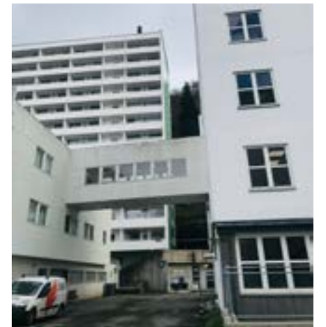
Haraldsplass Diakonale Sykehus AS. Diakonissene engasjerte Per Grieg som arkitekt for å få bygget et tidsmessig og rasjonalt sykehus med både kirurgisk og medisinsk avdeling. Siden den gang har sykehuset fått nye og flere bygninger og er i dag et stort kompleks som arkitekturhistorisk viser stor tidsdybde og variasjon i form og uttrykk.