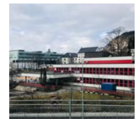
Haukeland skole er et karakteristisk eksempel på et skoleanlegg fra 1970-årene, innenfor retningen internasjonal modernisme. Et kompakt anlegg som består av to volumer som ligger fritt i forhold til hverandre med skoleplassen romslig i front. Bergen kommune ved byggseksjonen er prosjekterende arkitekt og utbygger i 1973.