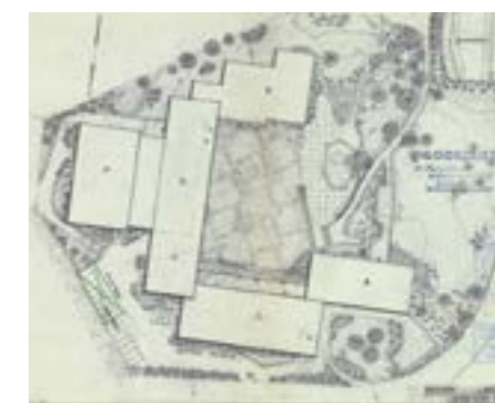
Landåssvingen, lærerhøgskolen. Utenomhusplan for Bergen offentlige lærerskole, senere kalt Bergen lærerhøgskole. Anlegget ble tegnet av arkitekt Aage Blich og oppført på Landås i 1965.