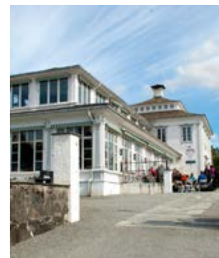
Fløyen folkerestaurant. På midten av 1800-tallet kom det også til et skifte i det «å gå på tur», og da Skog- og treplantningsselskapet bygget veier opp til platået, tok turvandringen virkelig av. I 1891 ble Fløystuen åpnet. Idéen med å lage kabelbane opp på Fløyen kom ikke lange etter. Bebyggelsen ved Fløybanens øvre stasjon består i hovedsak av tre bygninger; stasjonsbygningen 1918, Fløyrestauranten 1925 og verkstedbygningen i sin nåværende form i 1947/48. Alle tre er tegnet av arkitekten Einar Oscar Schau.