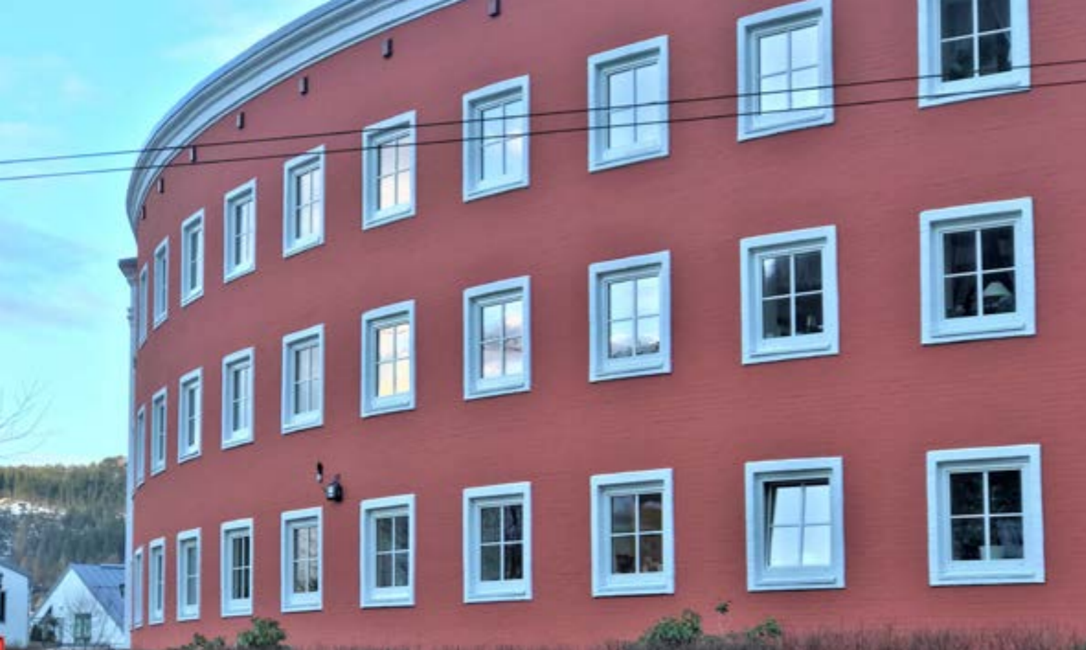
Handelstandens aldershjem i Årstadveien 27 ble tegnet av arkitekt Per Grieg i 1929. Bygningen er hesteskoformet og klassisk utformet med et regulært arkitektonisk uttrykk, med et sentrert inngangsparti i front som prydes med en statue av St.Sunniva.

Blant aldershjemmene i Bergen står den halvsirkelformede Handelstandens aldershjem på Årstad fra 1929 tegnet av Per Grieg i særklasse (fredet), likedan er Johannes Menighets aldershjem oppført i 1932 på Møhlenpris et flott uttrykk for Per Griegs forening av nyklassisisme og funksjonalisme. Per Grieg stod i 1947 også for utformingen av Trygdekassens bygg i Christies gate, i en mer rendyrket funksjonalisme.