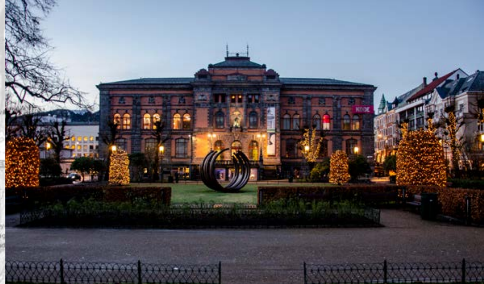
Kode 1. Permanenten. Vestlandske kunstindustrimuseum. Bygningen ble planlagt og bygget som museumsbygning, og grunnlagt som "Den permanente utstillingsbygning" i 1887. Den monumentale bygningen som ligger for enden av Byparken og Musikkpaviljongen som et halvt, eget kvartal, ble tegnet av arkitekt Henry Bertram Bucher med et uttrykk inspirert av nyrenessansen.