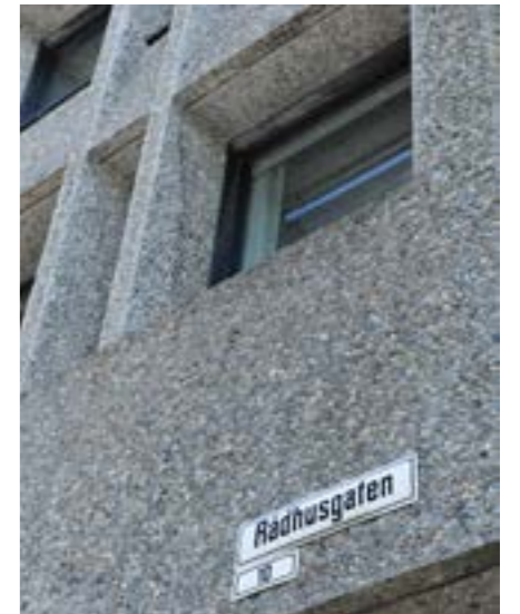
Det nye rådhuset i Bergen: Erling Viksjø tegnet rådhuskomplekset allerede i 1953 i forbindelse med at han vant arkitektkonkurransen, men rådhusblokken sto ikke ferdig før i 1971. Som mange av Viksjøs byggverk, og som det første i Bergen, ble rådhuset reist i naturbetong.