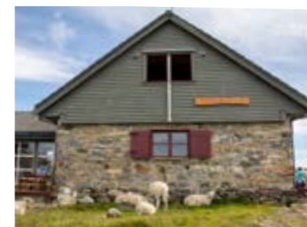
Den tredje Turnerhytten: 1886 ble den første hytten bygget i Hyttelien øst for Rundemanen. På få tiår ble det reist over 100 registrerte fritidshus i Byfjellene. Turnerhytten er en av disse, denne er gjenreist i 1988 for tredje gang etter forfall (1955) og brann (1985)