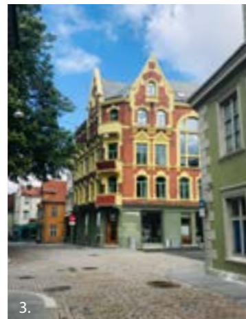
1. Forum kino. Arkitekt Ole Landmark var en av de fremtredende Bergensarkitektene. Forum regnes som Landmarks hovedverk og er unik i nasjonal sammenheng som et sjeldent eksempel på art deco-arkitektur i Norge. Kinoen ble påbegynt 1936, men ikke fullført før etter krigen i 1946. 2. Grieghallen er tegnet av den danske arkitekt Knud Munk og sto ferdig i 1978. Løsningen er tidstypisk, med eksponering av bærende konstruksjoner og byggematerialer. Rytmen i fasadene og speiling av omgivelsene i glassflatene, skalerer bygget ned og gir det en tilhørighet i byrommet. 3. Gimle i Kong Oscars gate 18 ble oppført som forsamlingshus i 1898, tegnet av arkitekt Schak Bull. Festsalen er fortsatt i bruk som et av byens best bevarte og tilgjengelige kultursaler. 4. Fensal i Kong Oscars gate 15, er en hjørnegård i mur i 4 etasjer med festsal som er oppkalt etter gudinnen Friggs bolig, Fensal. Bygningens arkitekt var arkitekt Erik Madsen og ble oppført 1900 for Håndverkssvennenes Forening.