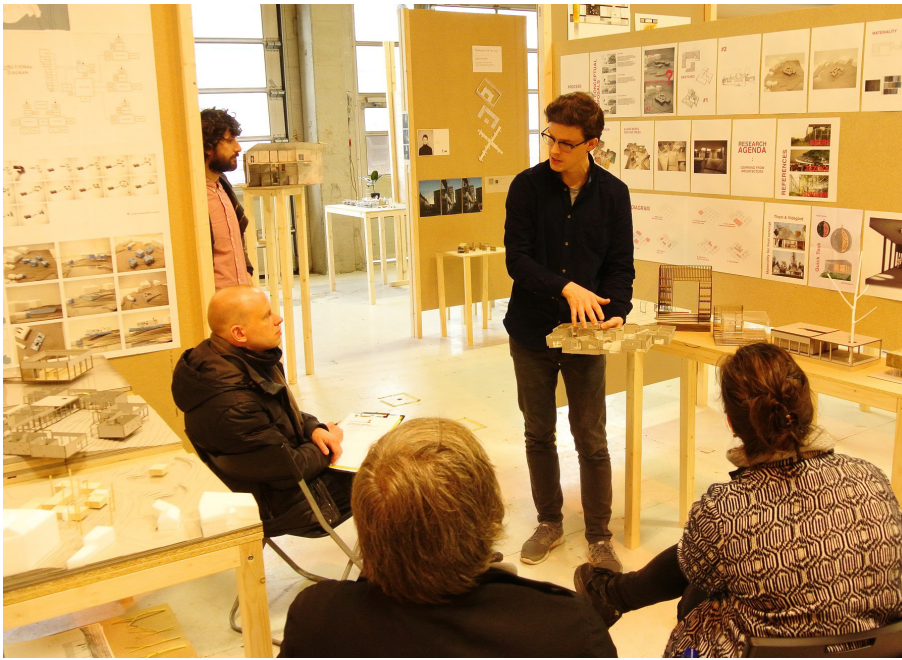
Bilde fra utstilling.