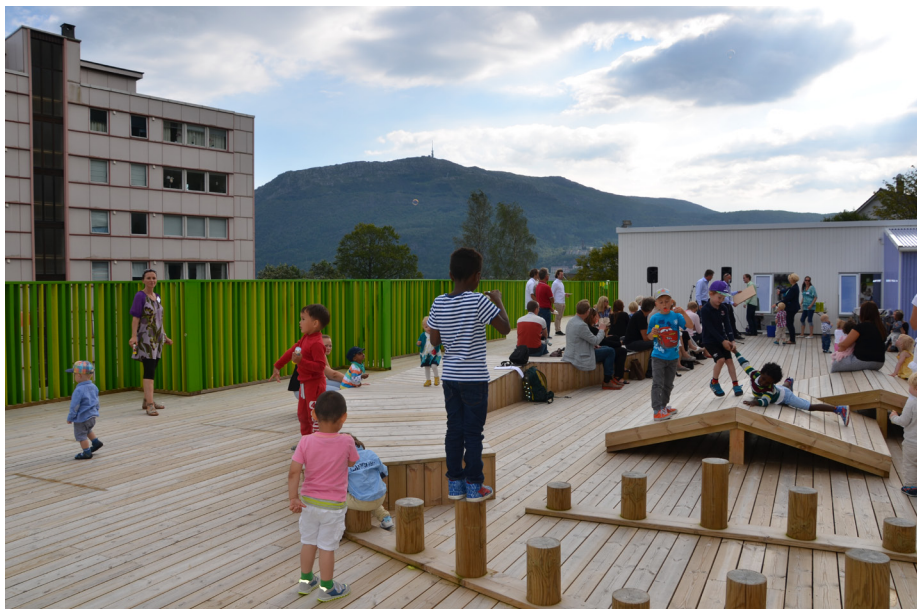
Solheimslie barnehage

Med inkluderende fellesskap menes at alle skal føle seg inkludert i fellesskapet i Solheimslie barnehage, uansett bakgrunn, kjønn, kultur, religion og legning. Ansatte, barn og foreldre er en mangfoldig gruppe med ulik alder, kjønn, bakgrunner og ulike språk. Dette gir barnehage et Interkulturelt miljø som gir barna en god dannelses- og læringsarena.