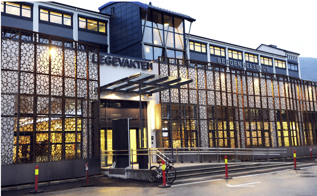
Bergen Helsehus