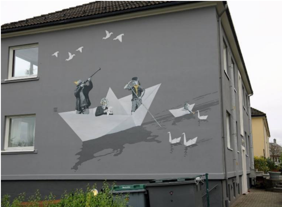
Sambrukshuset. På nordsiden av bygget er det kunstnerisk utforming, et arbeid som er utført av Gatekunst ved Skurk.

Etat for boligforvaltning (EBF) i Bergen kommune har rustet opp sambrukshuset og gjort huset universelt tilgjengelig.