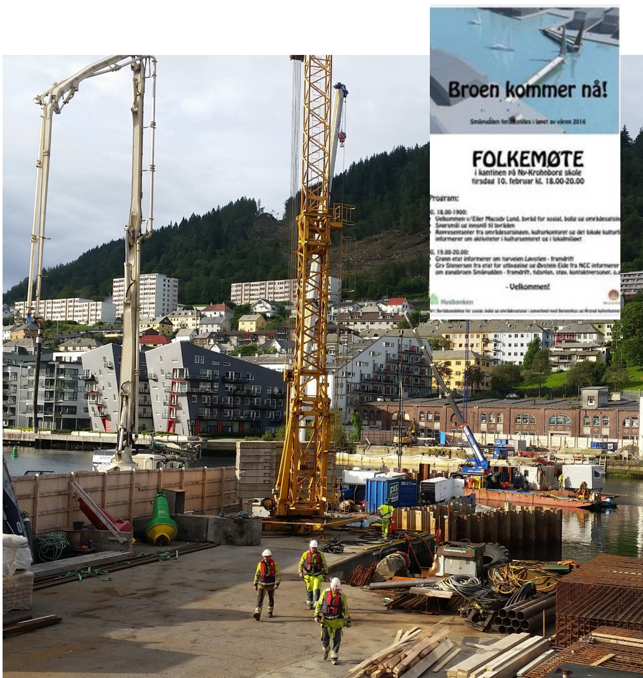
Grunnarbeider for "Småpudden" i full gang.

På folkemøte var bygging av «Småpudden», og dens fremdrift et viktig tema.