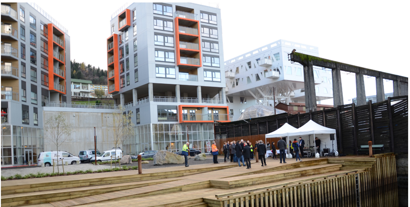
Damsgårdsallmenning ble offisielt åpnet 30.oktober 2013.

Når det gjelder Solheimsgaten ble det søkt midler fra prosjektet «Fremtidens byer», og målsettingen med arbeidet med Solheimsgaten er å gjøre den til «Grønn gate». Det vil foreligge ideskisser utpå vårparten og det vil bli arrangert møter med representanter fra nærmiljøet og beboere for å diskutere skissene. Dette arbeidet vil også være en del av det arbeidet Bergen kommune skal vise/ dokumentere i forbindelse med avslutningen av prosjektet.