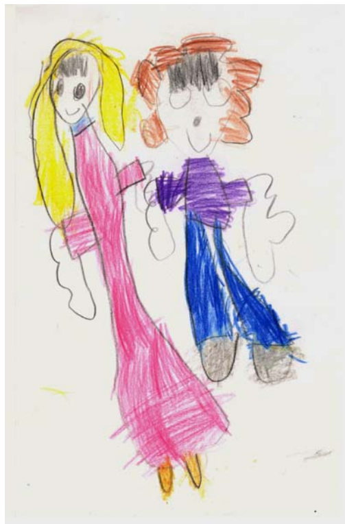
Tegnet av Ingrid Ornum, 5 år