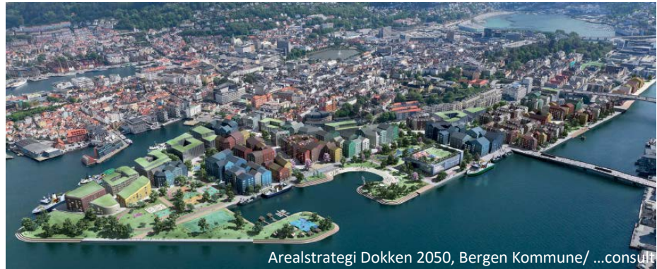
Arealstrategi Dokken 2050, Bergen Kommune/ ...consult