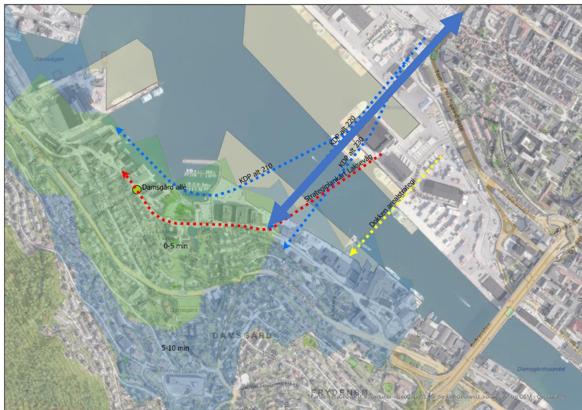
Figur 2. Mulig siktlinje fra Nøstegaten til bro. Eventuelt kan siktlinjen gå i parallellgate til Nøstegaten på Dokken

sider av fjorden, og at bydelene i større grad kan dele på sosial infrastruktur og andre funksjoner. Bydelene kan bli ett arbeids-, handels- og boligfelleskap, der alt er innenfor gangavstand. I forslag til arealstrategi ligger broen 250 m lenger sør enn strategiplankartet og midtre alternativ i kdp. Omtrent alle målpunkt, inkludert gang-/sykkelatkomst til Bergen sentrum, ligger nord for broen, slik at økt gangavstand blir 500 m.