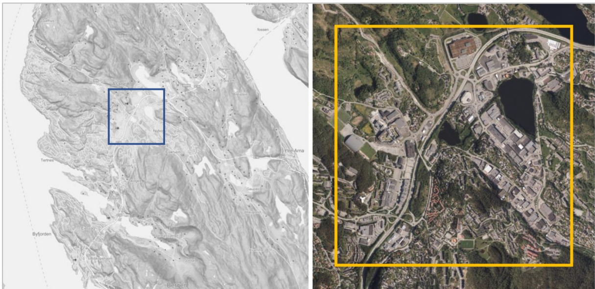
Figur 1: Avgrensning av planområde for strategisk planprogram, oversiktskart og flyfoto

I årsoppdrag til Plan- og bygningsetaten for 2018 – 2019 er det lagt inn et oppdrag om å «Utvikle en strategi for byreparasjon med Åsane bydel som pilot». Plan- og bygningsetaten mener at oppdraget best kan løses gjennom utarbeidelse av et strategisk planprogram etter mønster av Laksevåg, Birkeland/Blomsterdalen og Loddefjord. Det anbefales derfor oppstart av et arbeid med et strategisk planprogram for å legge til rette for en helhetlig byutvikling i Åsane sentrale deler.