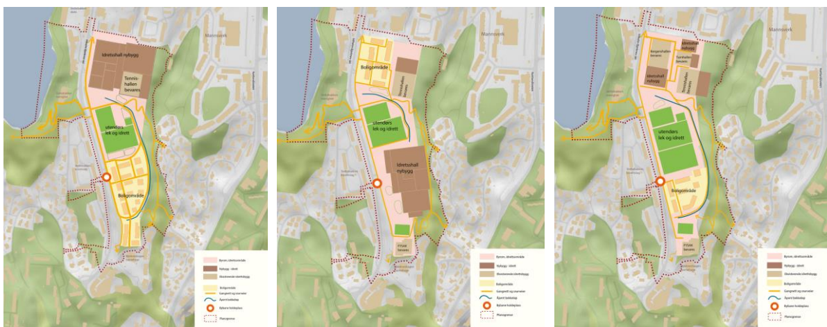
Figur 2-1 Alternativ 1 til venstre, alternativ 2 i midten og alternativ 3 til høyre som fremmet i planprogrammet. Illustrasjon: Bergen kommune