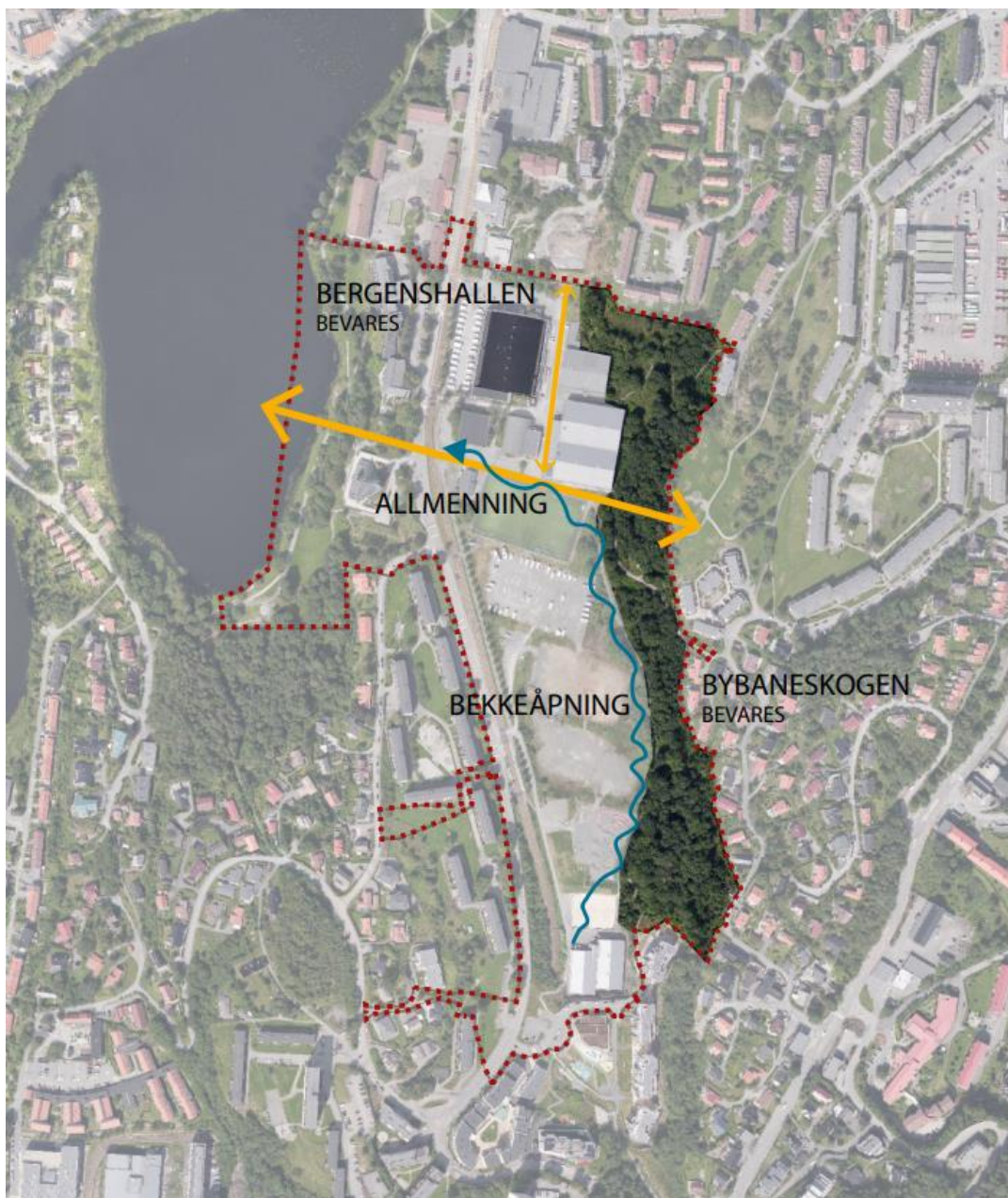
Figur 4-1 Illustrasjon av viktige funn fra konsekvensutredning miljøtema. Illustrasjon: Bergen kommune