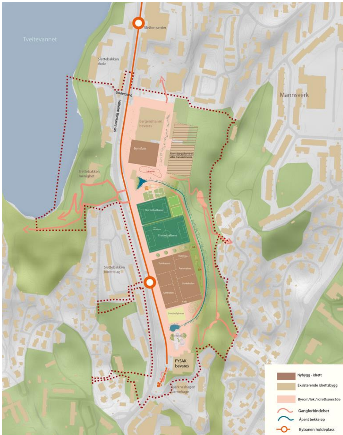
Figur 4-2 Sammenstilling av hovedgrep som er basert på utredningsfasen.

Grepet skal danne grunnlag for videre arbeid med byforming og detaljert innhold, frem til et planforslag. Under er det tegnet opp en grovskisse av grepet, i samme form som alternativene. Det er nødvendig å arbeide videre med struktur, form og innhold, særlig for bygninger.