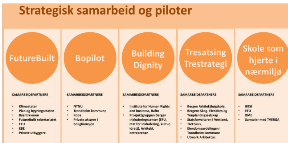
Figur 2: Byarkitektens strategiske samarbeid og pilotprosjekter