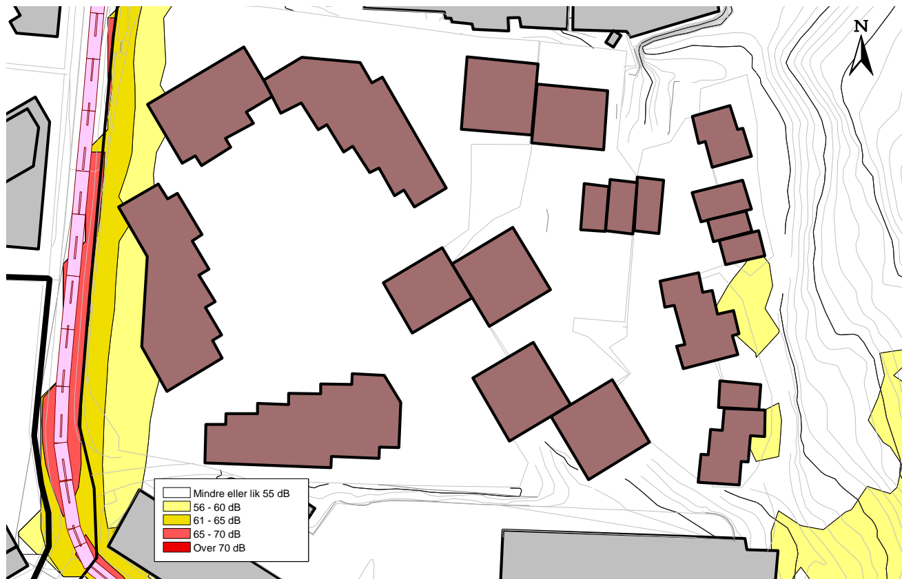
Figur 3: Beregnet støynivå L_{den} ved uteoppholdsareal 1,5 m over terreng.

Det vil være noe areal øst for byggene lengst i øst som får overskridelser av grenseverdi L_{den} = 55 dB.