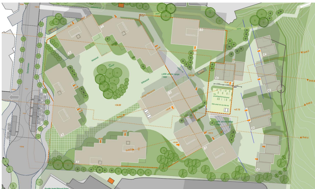
Figur 2: Situasjonsplan (mottatt fra Link Arkitektur den 08.03.2023.)

Området er påvirket av støy fra Sandsliåsen. Det er planlagt et langsgående bygg mot denne veien som vi skjerme området innenfor for støy. Tiltaket er også påvirket av støy fra Fana skytterlags skytebane.