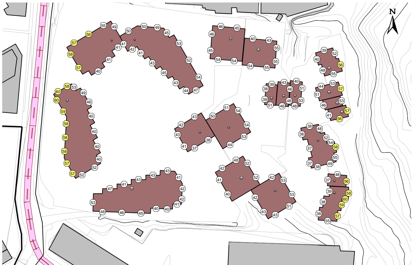
Figur 4: Utendørs støynivå L_{den} ved fasader. Figuren viser høyeste nivå uavhengig etasje høyde.

Ved byggene i midten er støynivå ved fasader L_{den} \leq 55 dB, og det settes ikke krav til planløsning.