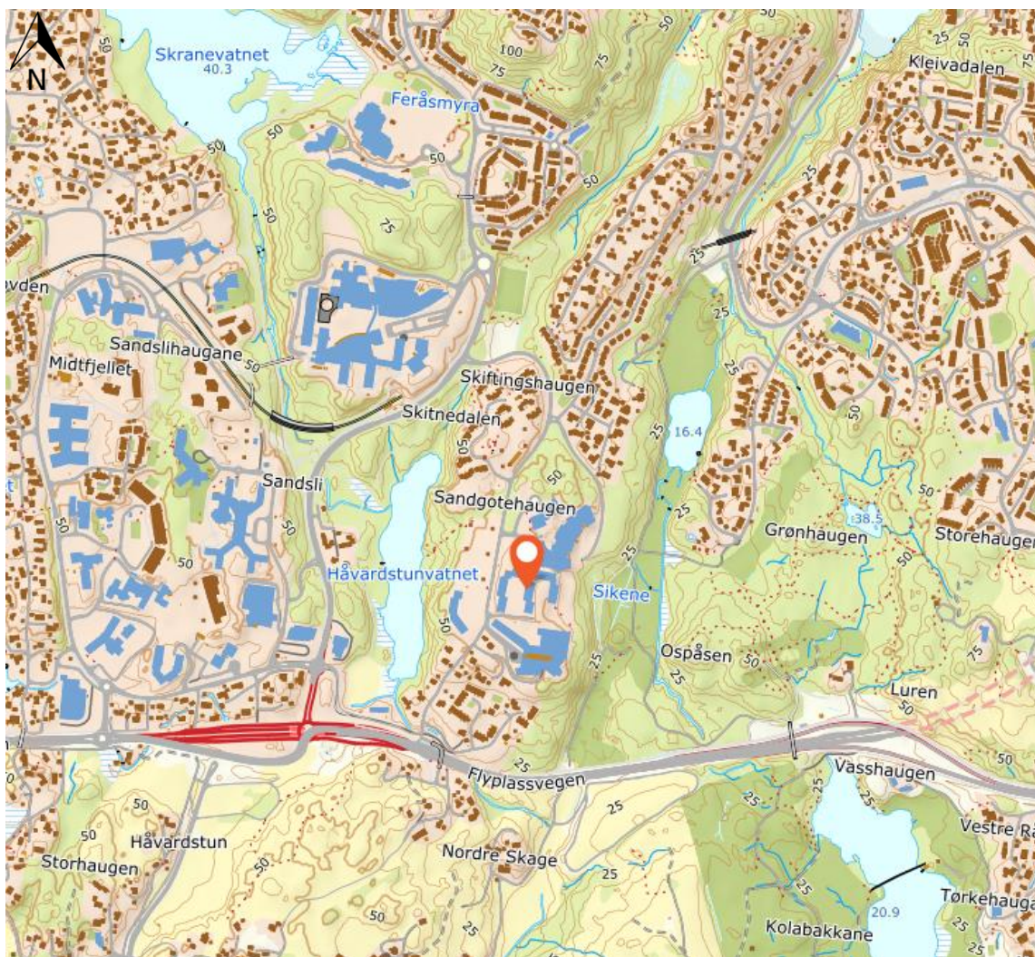
Figur 1: Oversiktskart, aktuell tomt markert med rød pil (norgeskart.no 25.01.2023)