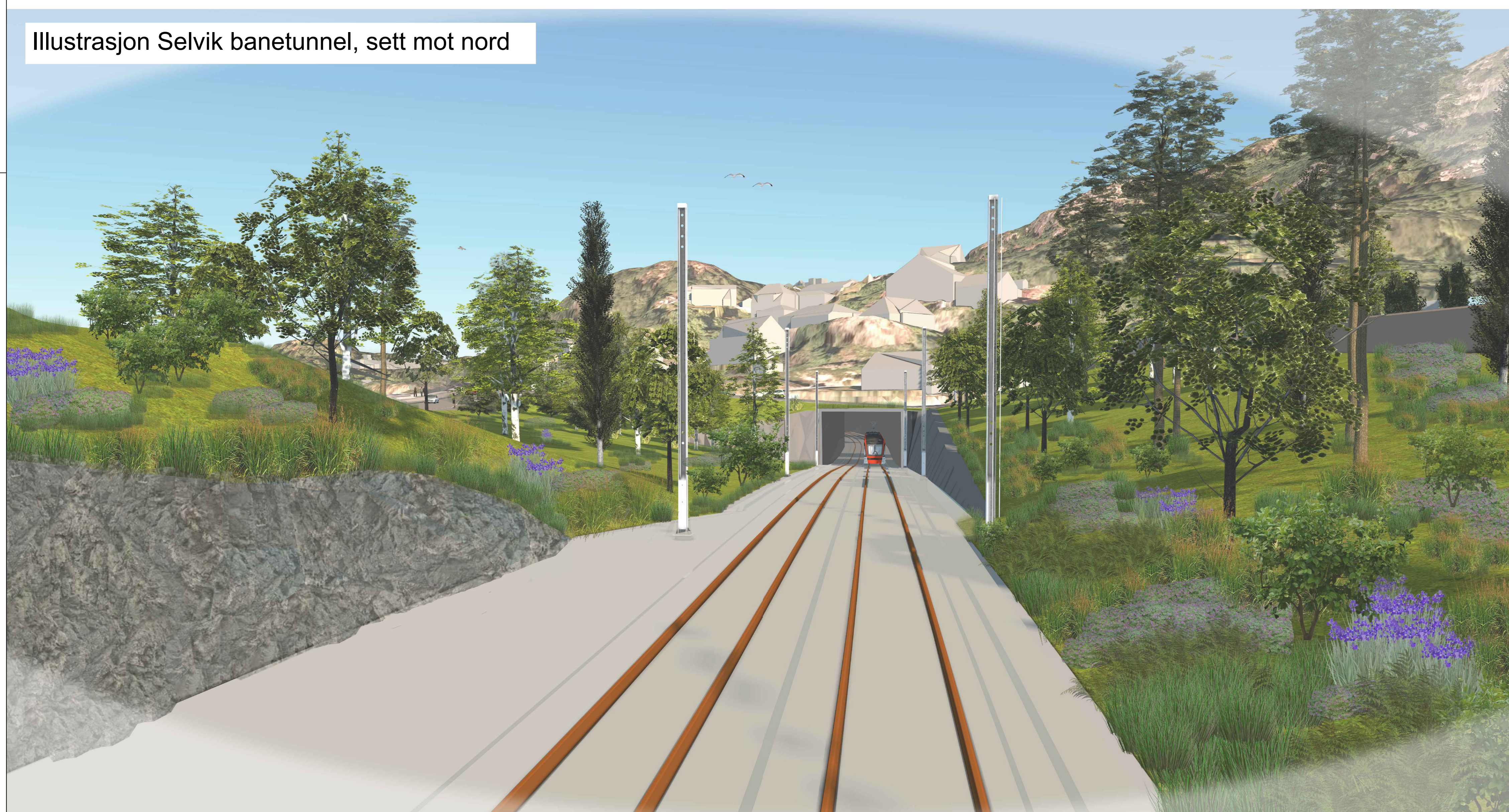
Illustrasjon Selvik banetunnel, sett mot nord