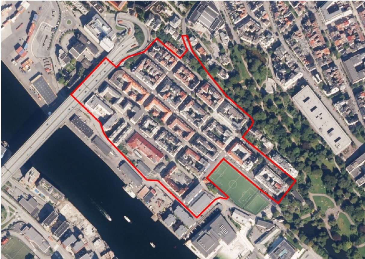
Figur 1: Området for gatebruksplanen

Området for gatebruksplanen omfattar dei kommunale gatene på Møhlenpris innafor den raude avgrensinga som vist i figur 1. Området er om lag 100 dekar stort. Møhlenpris er eit sentralt bustadområde i Bergenhus bydel. Møhlenpris er eit kulturmiljø av nasjonal interesse som eit godt døme på ein bydel frå slutten av 1800-talet og byrjinga av 1900-talet, der det opphavlege gatenettet i stor grad er bevart.