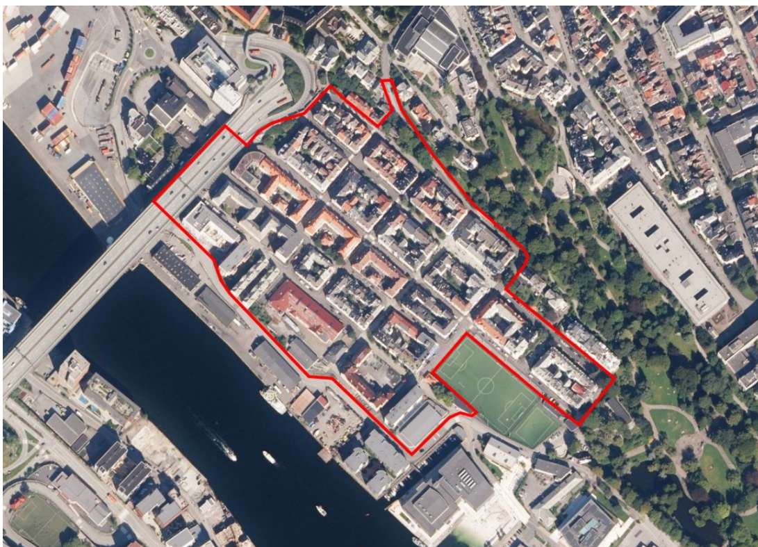
Figur 1: Gatebruksplanområdet

Gatebruksplanområdet omfatter de kommunale gatene på Møhlenpris innenfor den røde avgrensningen som vist i figur 1, og er ca. 100 dekar stort. Møhlenpris er et sentralt boligområde i Bergenhus bydel, med gangavstand til Marineholmen, Nygårdshøyden, Nygårdsparken og sentrum. Møhlenpris grenser også til det fremtidige byutviklingsområdet på Dokken. I tillegg til boliger er det 2 mindre dagligvareforretninger, 1 butikk, flere helse- og omsorgsinstitusjoner, og enkelte kultur-, utdannings- og fritidstilbud i området.