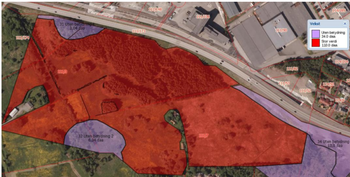
Figur 4: Verdivurdering av matjord

Vassdraget Storaveita renn gjennom nordlege og vestlege del av planområdet. Det går i kulvert under Flyplassvegen og bybanetraséen, og går vidare i nordvestleg retning vidare til Langavatnet ved Bergen lufthamn Flesland (sjå figur 5 og 6).