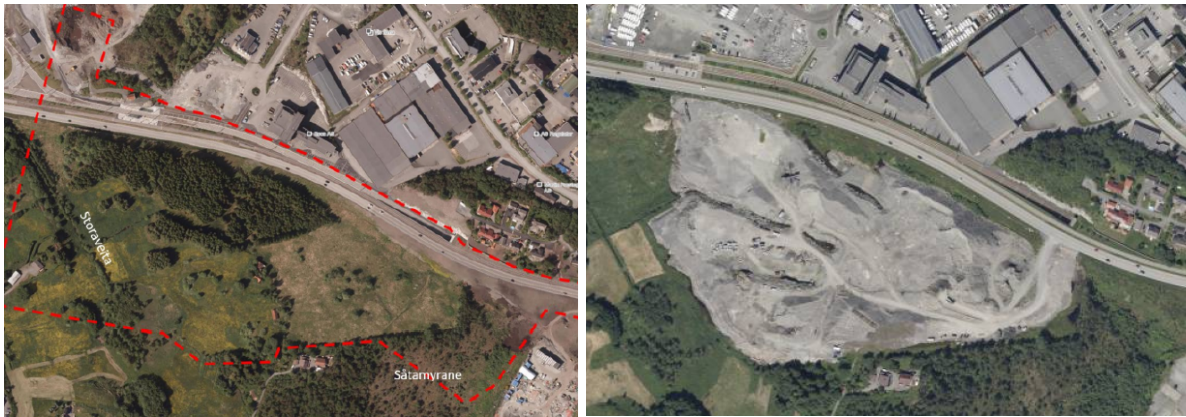
Figur 2 og 3: Planområdet i 2018 og i 2022