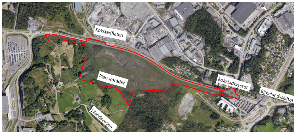
Figur 1: Planområdet

Opus Bergen AS har på vegner av Kokstad Property AS (heretter forslagsstillar) lagt fram planforslag for eit område på Liland i Ytrebygda bydel. Føremålet med planforslaget er å legge til rette for etablering av arealkrevjande næring.