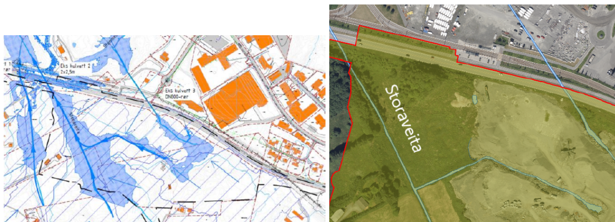
Figur 5 og 6: Vassdraget Storaveita

Vassdraget Storaveita renn gjennom nordlege og vestlege del av planområdet. Det går i kulvert under Flyplassvegen og bybanetraséen, og går vidare i nordvestleg retning vidare til Langavatnet ved Bergen lufthamn Flesland (sjå figur 5 og 6).