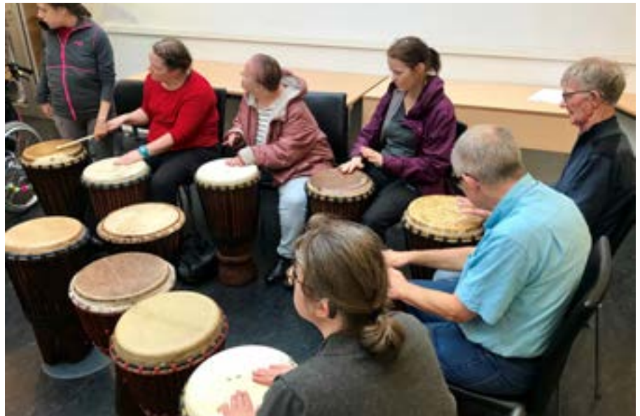
Tekst og foto: Alma Valle

Fin kveld med Trommelars på besøk i Åsane fritidsklubb