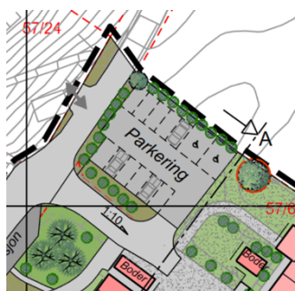
Figur 2. Illustrasjonsplan

Byråden kan ikke se at det vil være mulig å øke antall parkeringsplasser uten å utvide arealformålet inn i et annet felt, eller utenfor plangrensen.