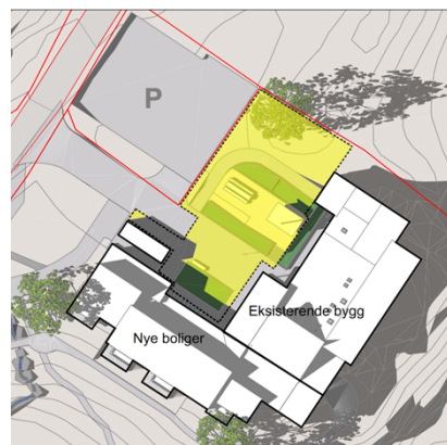
Figur 3. Sol- og skyggeillustrasjoner