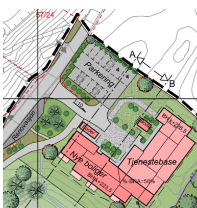
Figur 2. Illustrasjonsplan