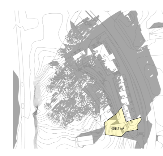
21.03 kl 1600 407m 2

Plannavn Ytrebygda, gnr. 34/ bnr. 118, m.fl. Ytrebygdsvegen. Plantype Detaljreguleringsplan Tegning MUA plan - solkrav