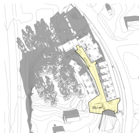
21.03 kl 1200 723m 2