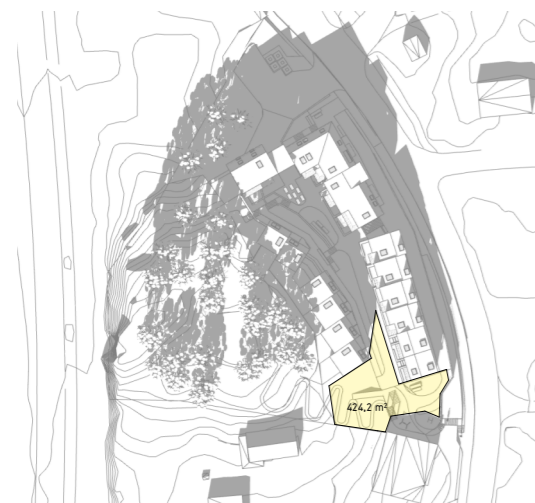
21.03 kl 1400 424m 2