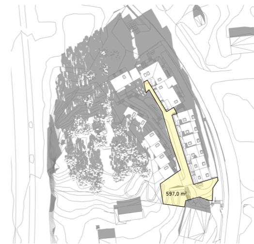
21.03 kl 1300 597m 2