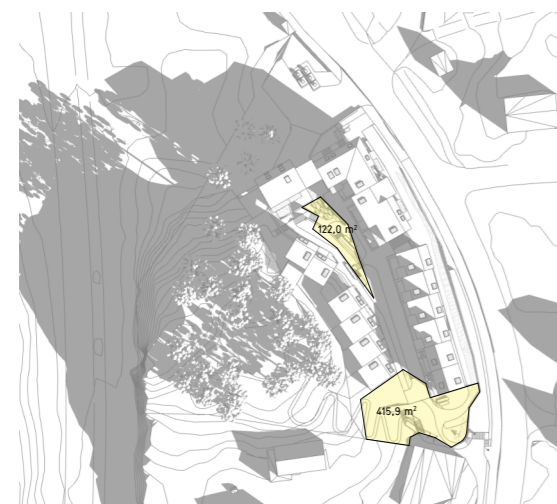
21.03 kl 1000 538m 2

Krav til solforhold ihht. KPA2018 er oppfylt.