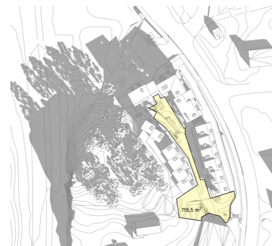
21.03 kl 1100 720m 2