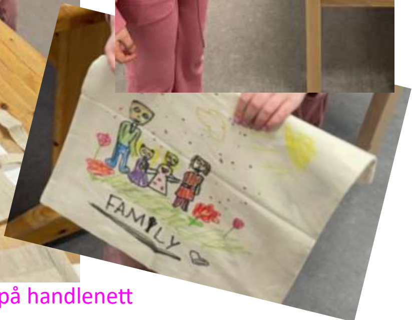
Tekstiltusj på handlenett