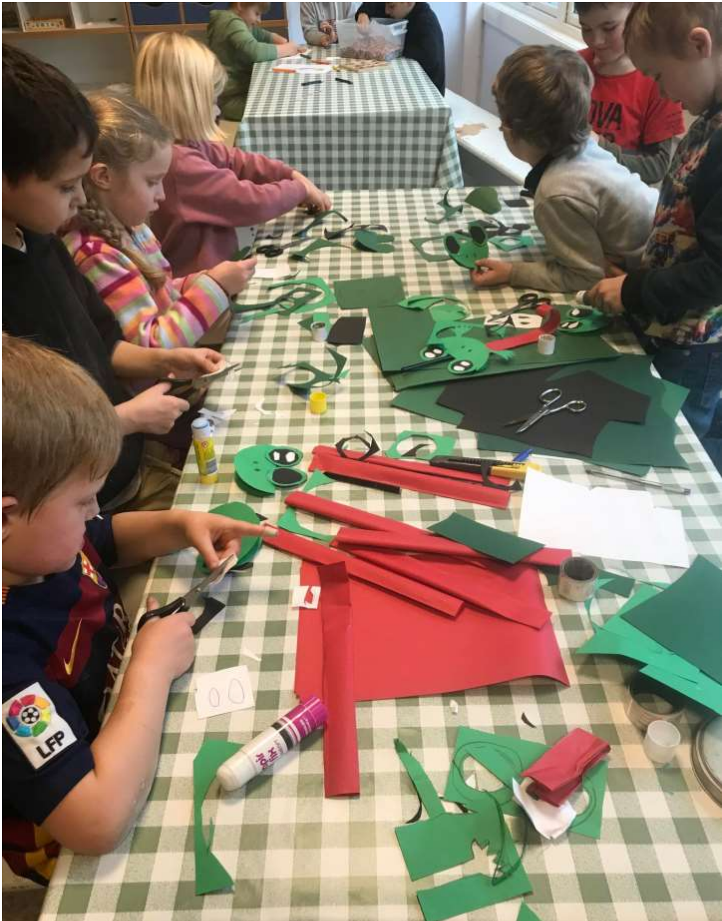
I gang med 3D- frosker