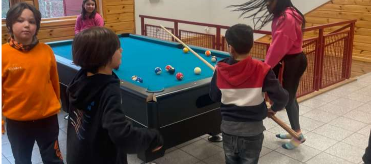
Billjard og fredagsfilm