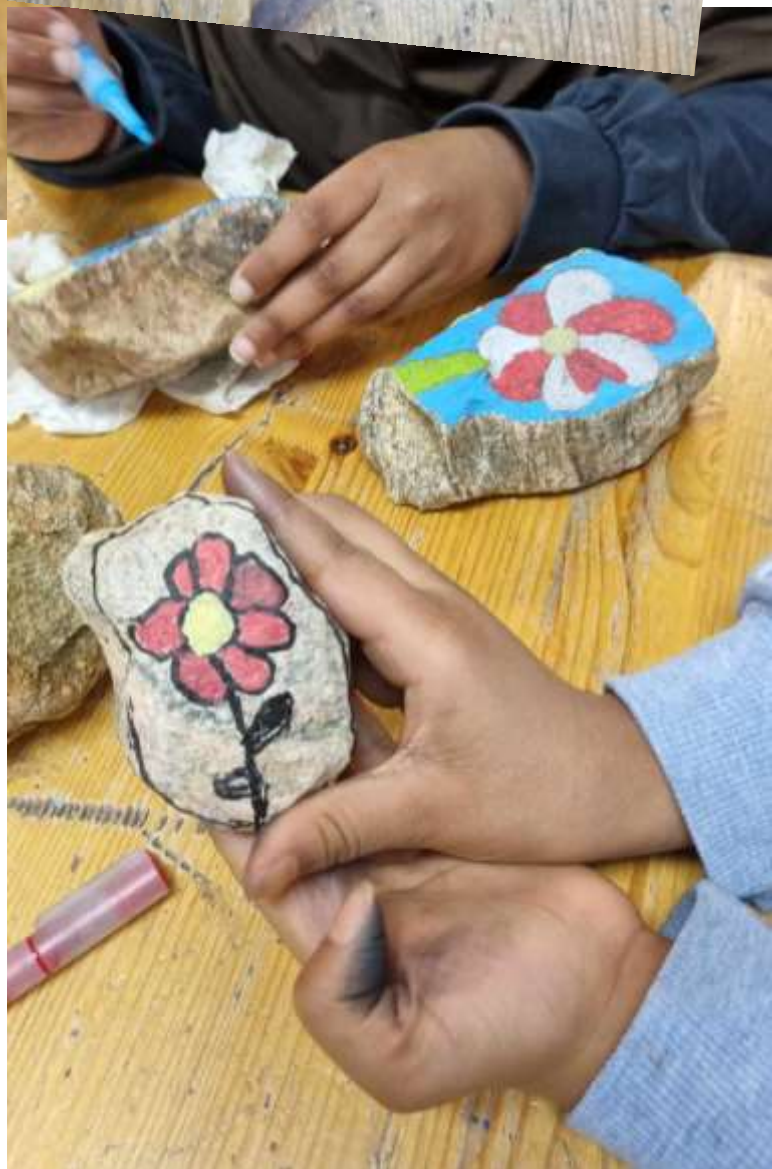
Dagens mysterieaktivitet i bygg 3: Finne steiner ute til å tegne på med «steinturj»