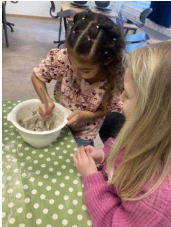
1. trinn lagde sitt eget modelerskitt!