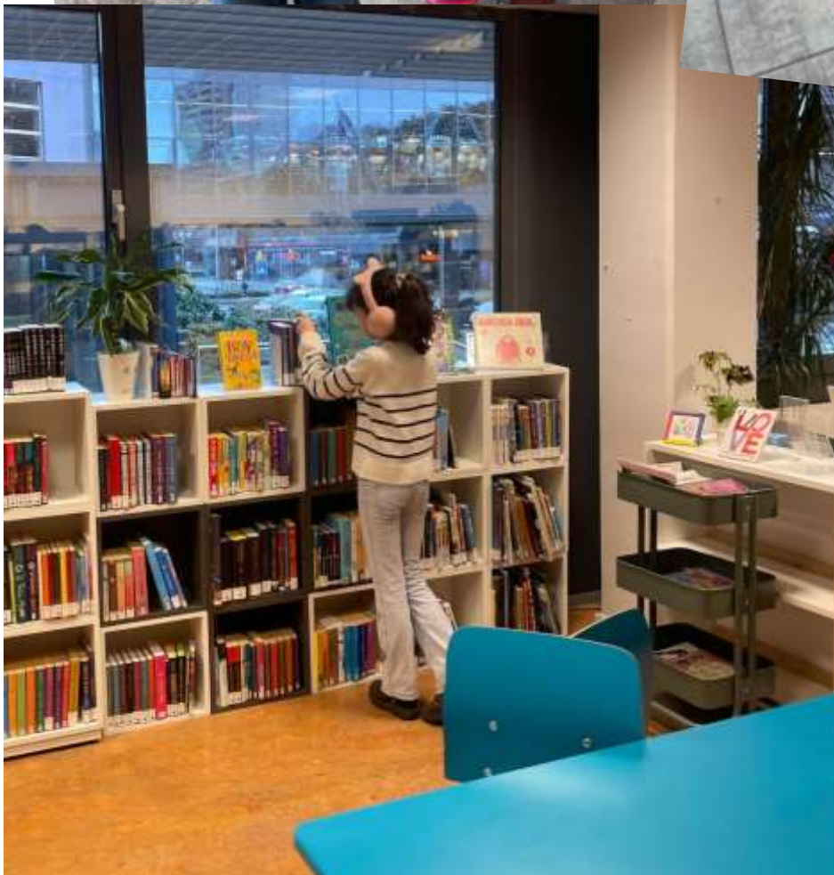
Aktiviteter vestkanten bibliotek