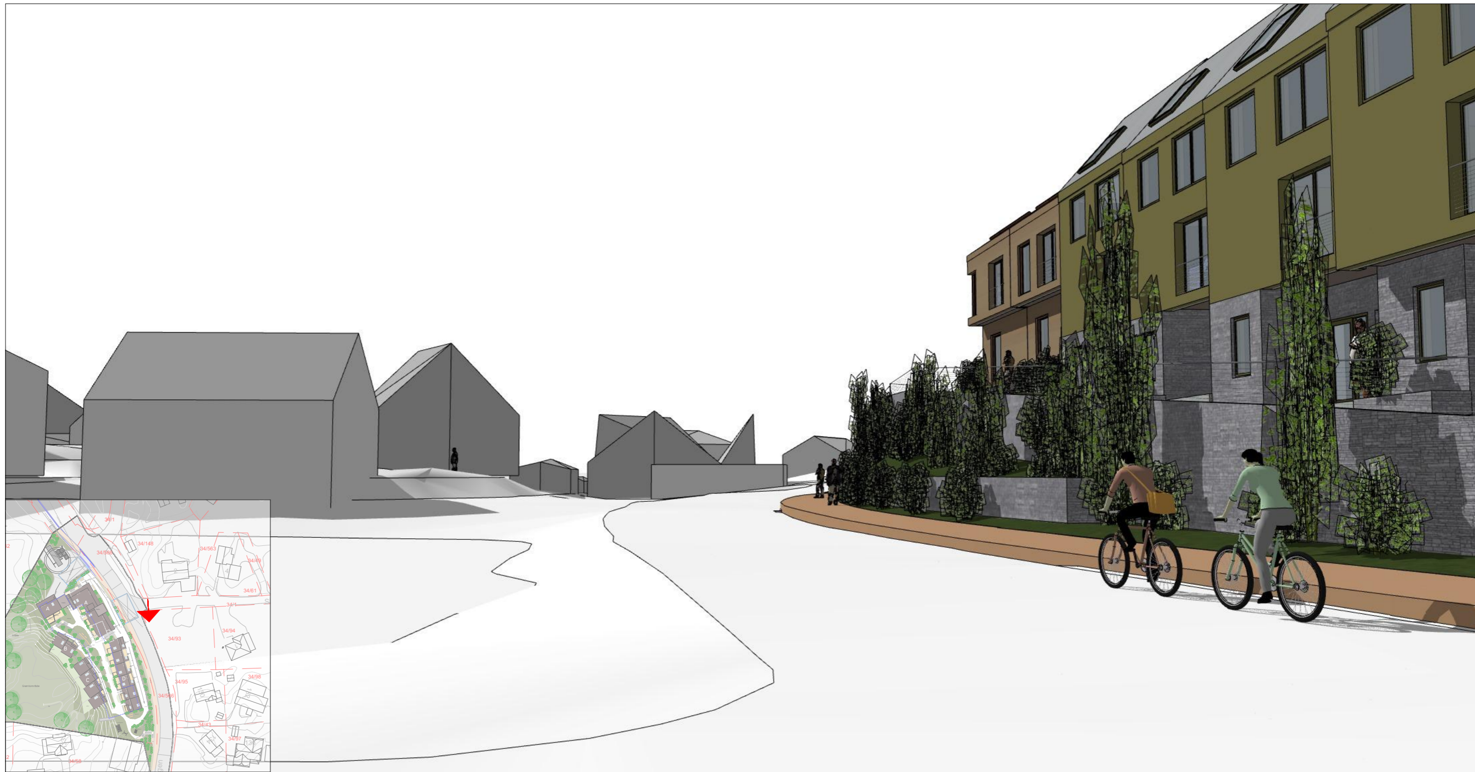
Perspektiv fra Skraneskogen