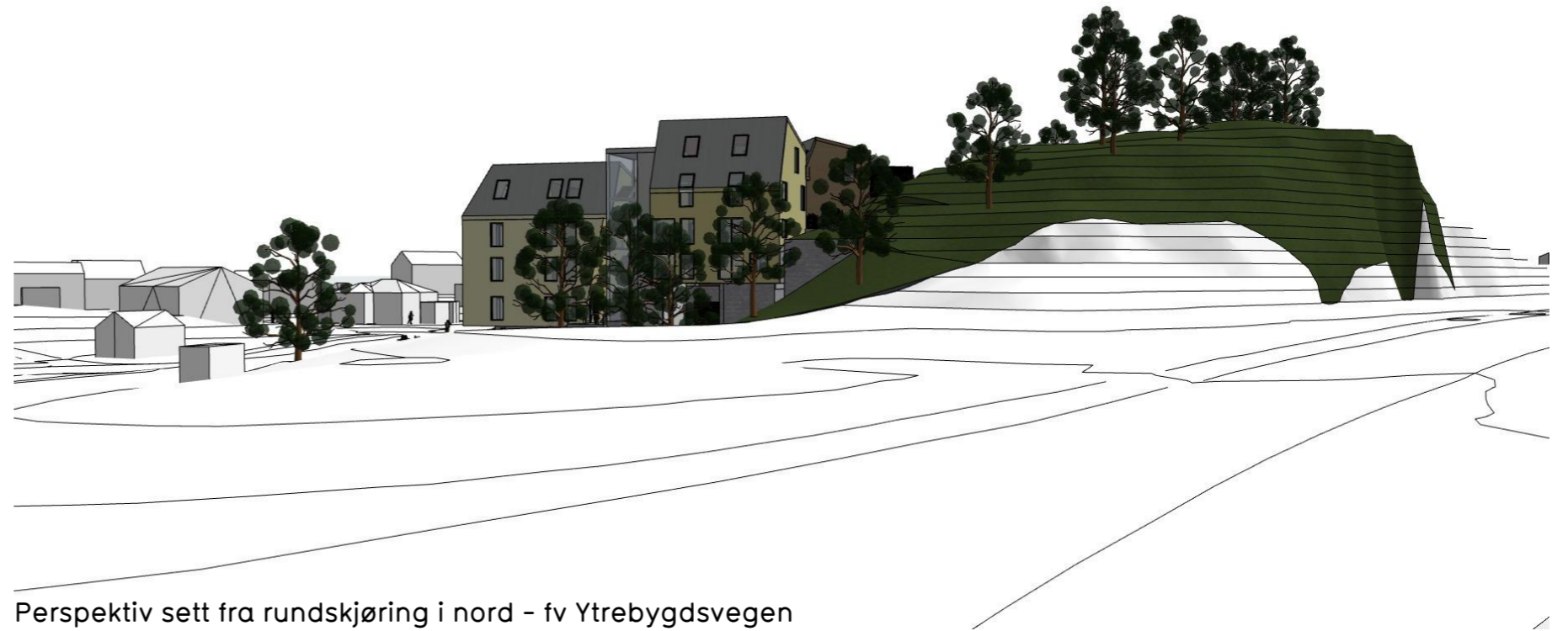
Perspektiv sett fra rundskjøring i nord - fv Ytrebygdsvegen