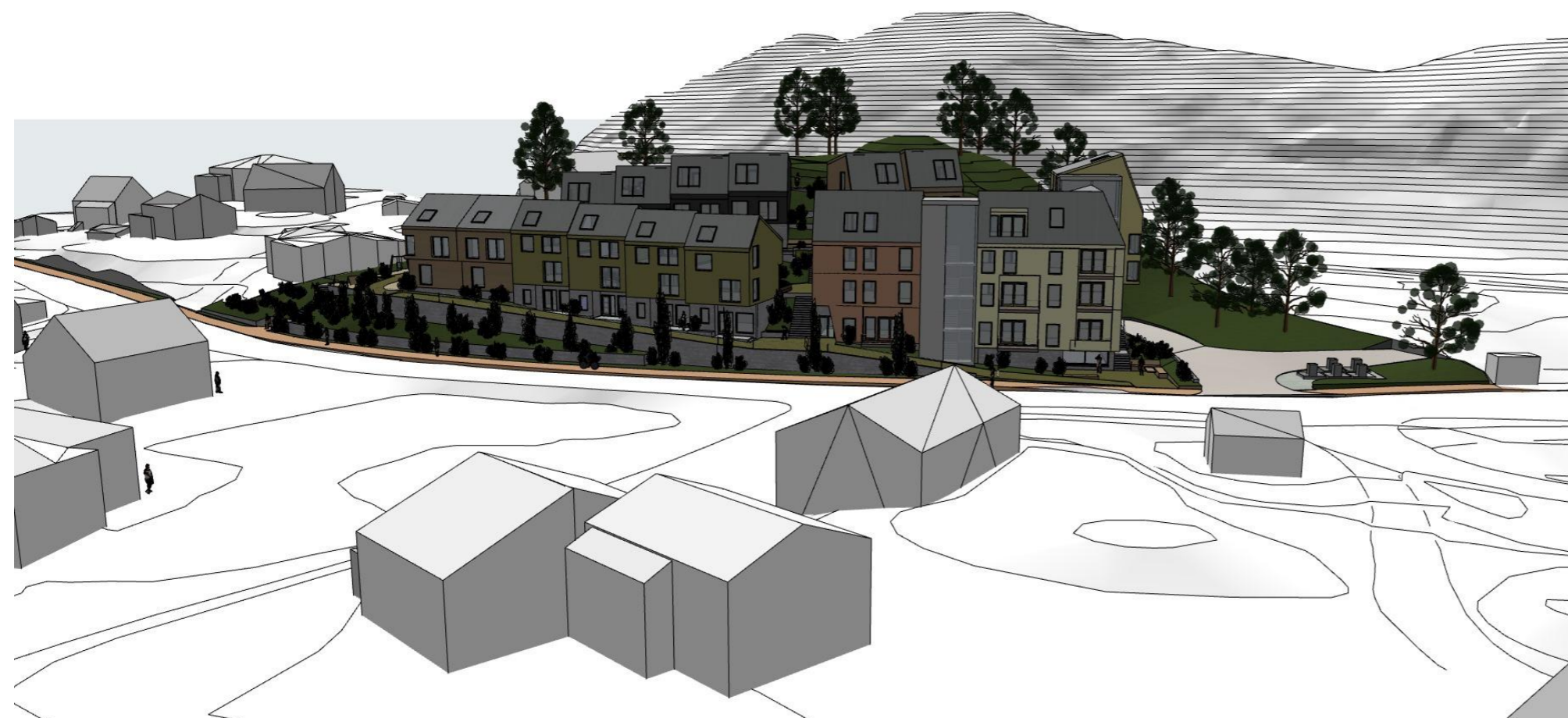
Perspektiv sett fra øst