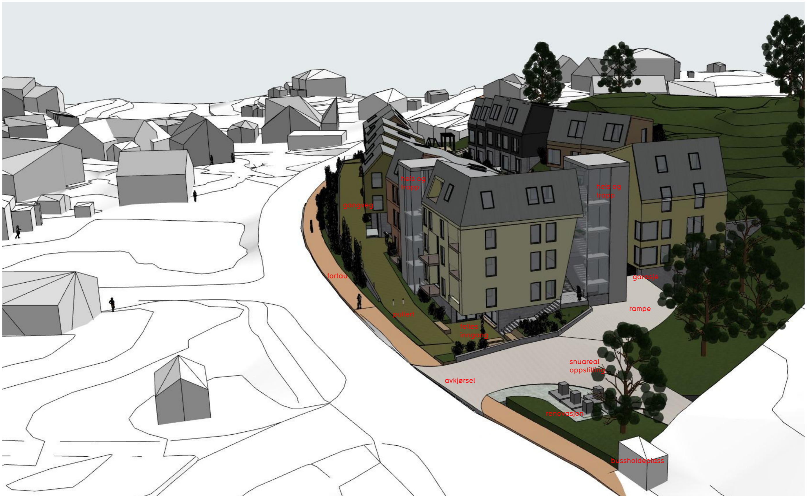
Perspektiv tatt fra nord mot sør -

Plannavn Ytrebygda, gnr. 34/bnr. 118, m.fl. Ytrebygdsvegen. Plantype Detaljreguleringsplan Tegning Perspektiver 2 Forslagsstiller: FM Gruppen AS