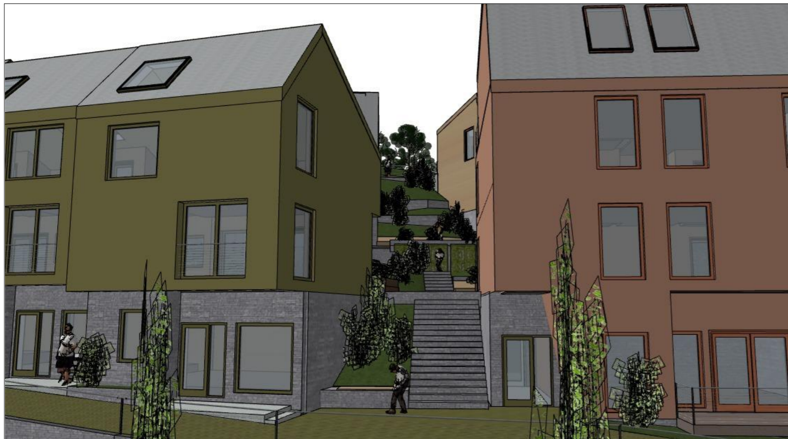
Øst: Gangpassasje til "boliggaten" og siktlinje til kollen