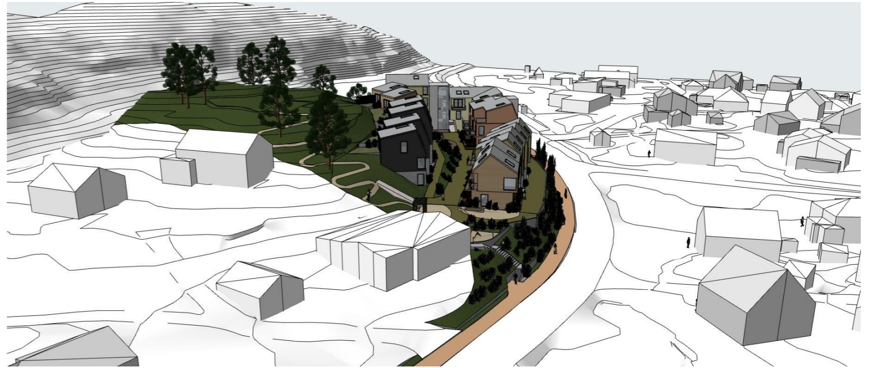
Fugleperspektiv - sett fra sør mot nord Viser trapp som kobler ny boliggate med nytt fortau i retning bybanestopp Sandslimarka