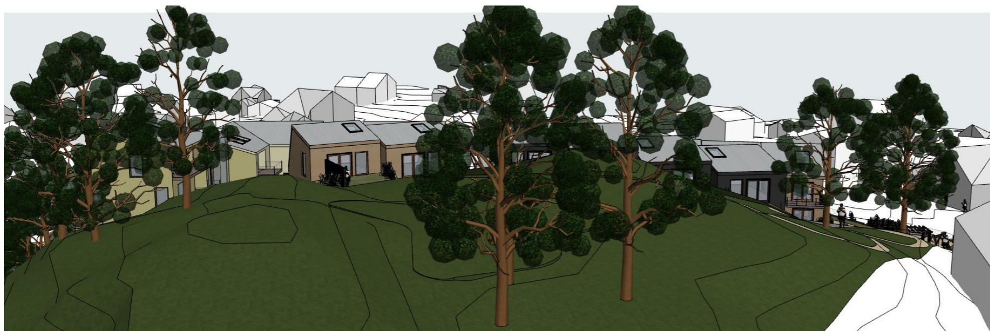
Perspektiv fra naturområdet/kollen, ser mot bebyggelsen i øst