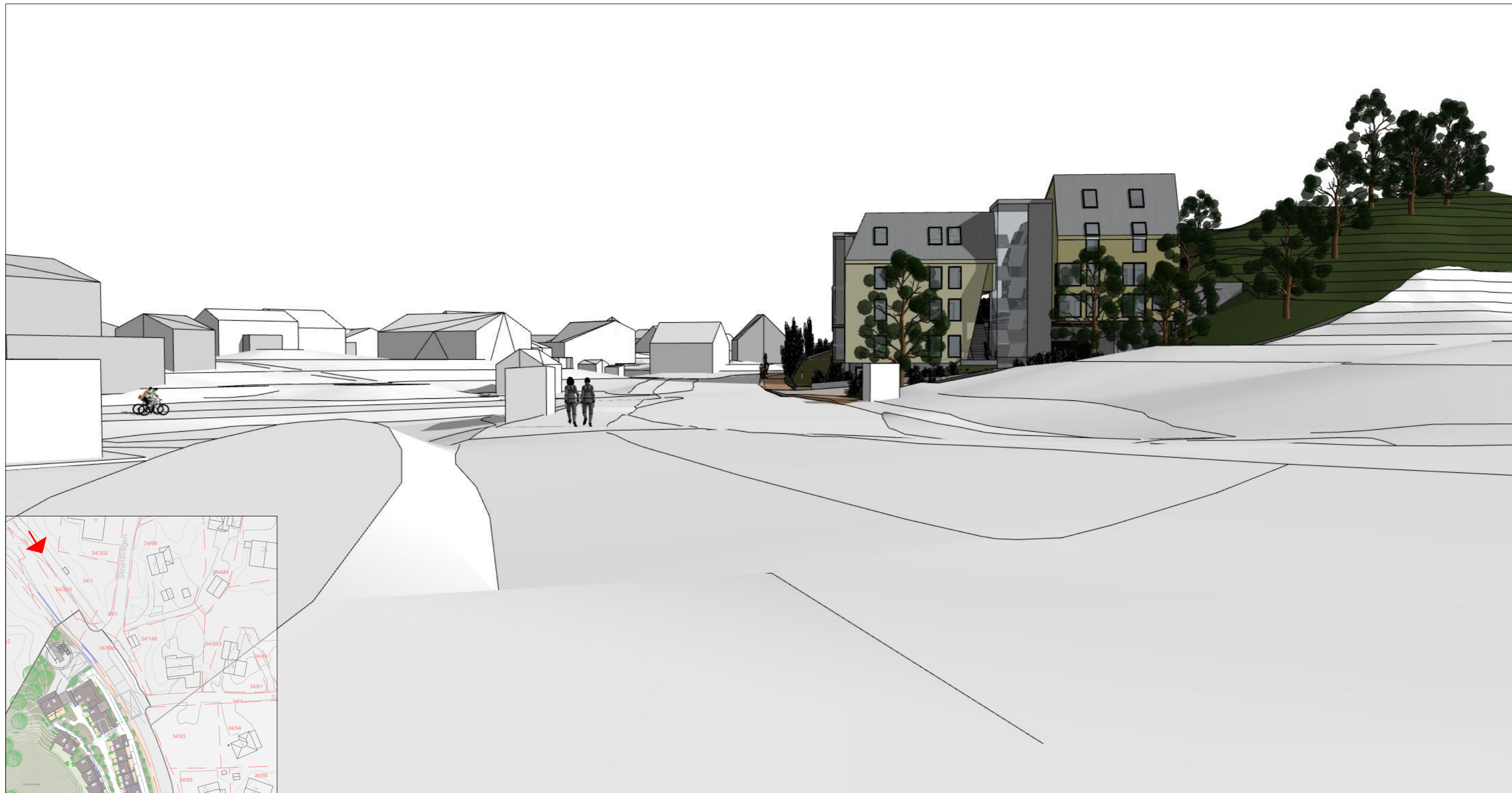
Perspektiv fra nord