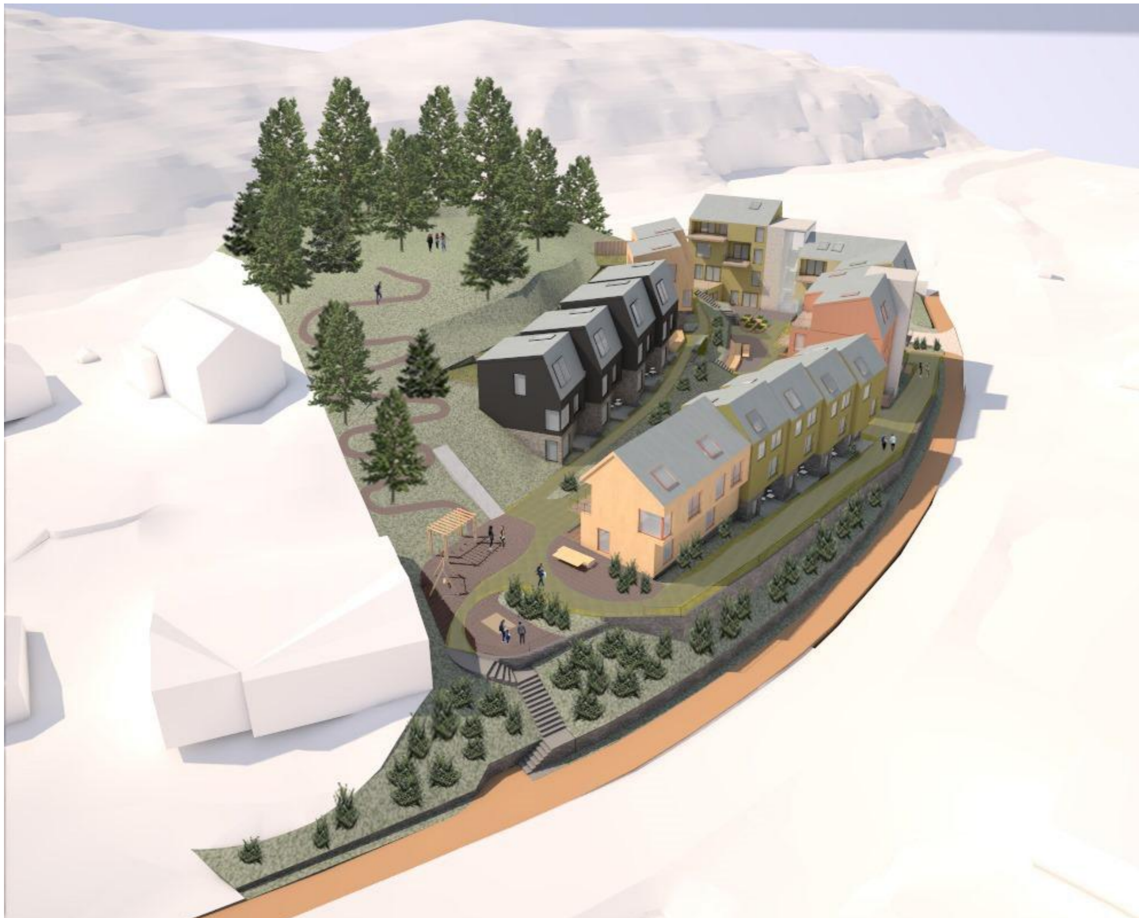
Fugleperspektiv tatt fra sørøst