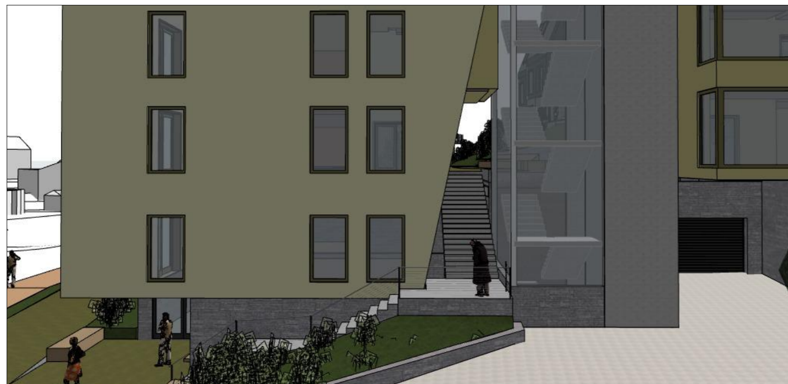
Nord: Gangpassasje igjennom bebyggelsen, fra hovedadkomst til felles uteoppholdsareal og rekkehus i "boliggaten". Siktlinje til "boliggaten" går igjennom passasje og igjennom trapperom med glassfasade.