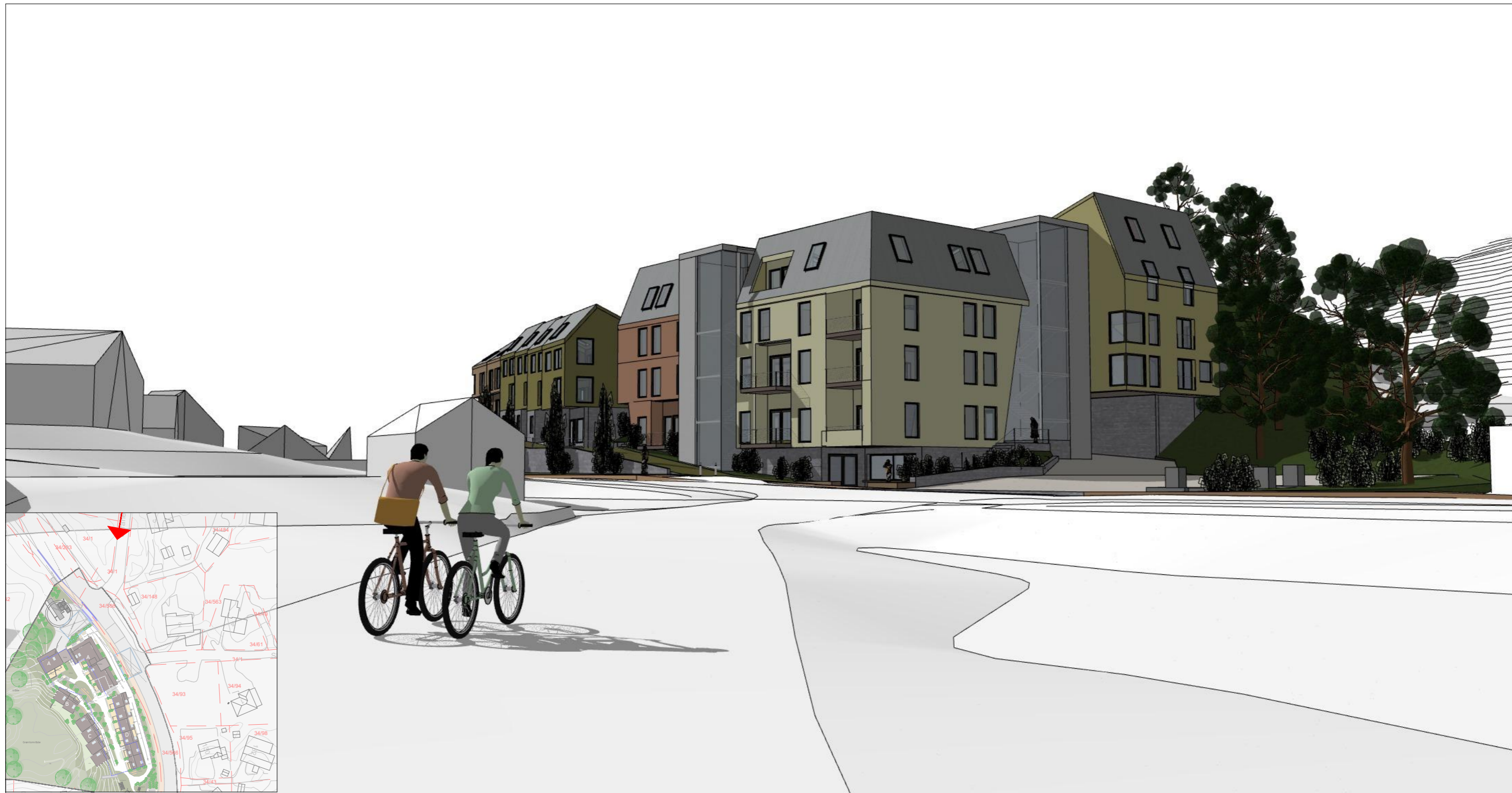
Perspektiv fra Skranevegen