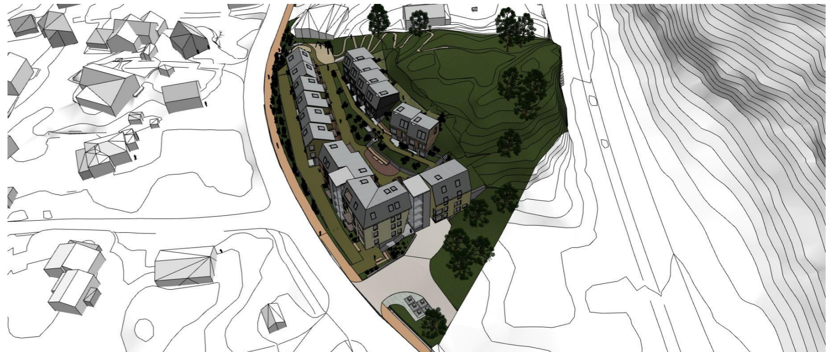
Fugleperspektiv - sett fra nord