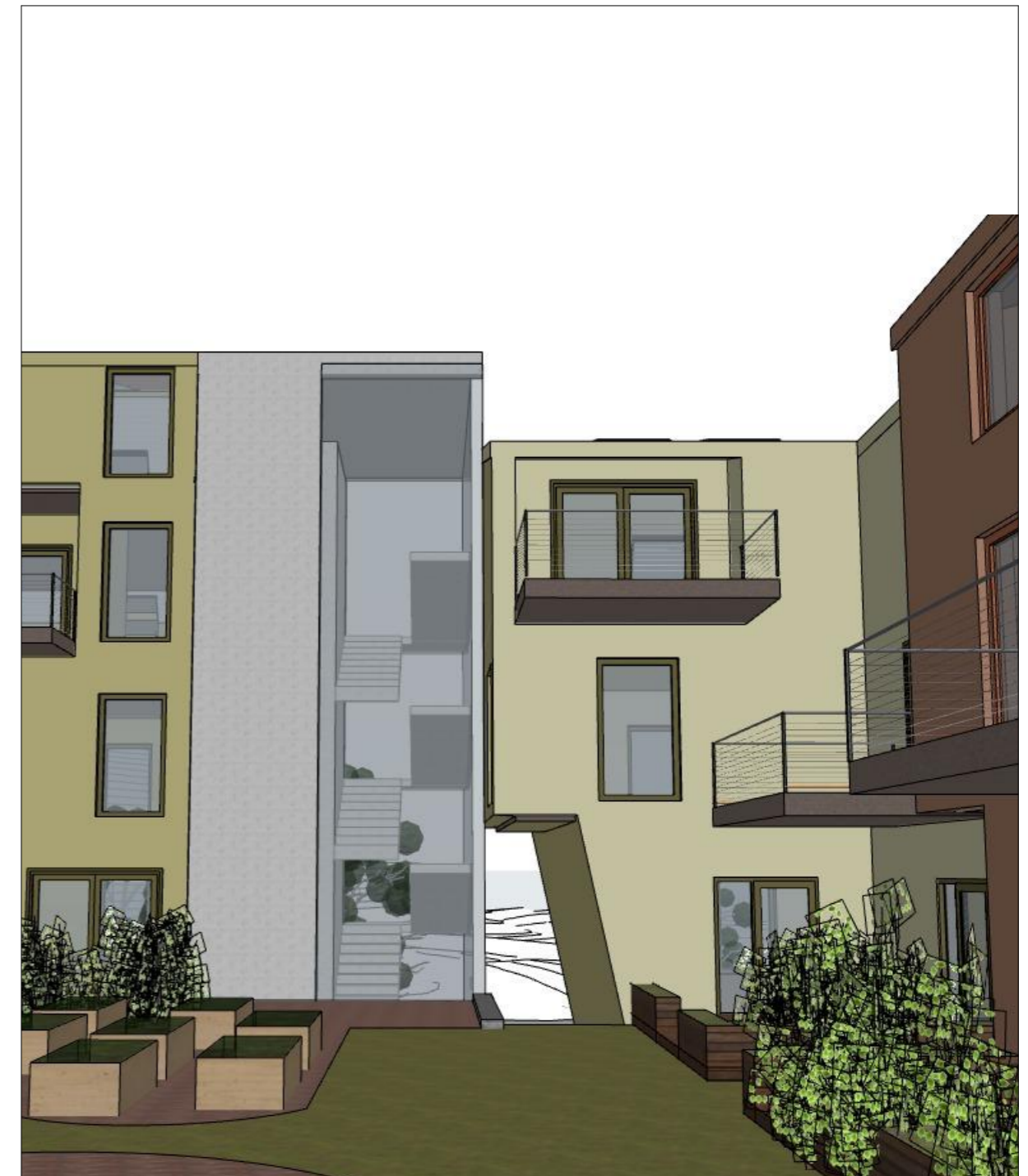
Nord: Gangpassasje igjennom leilighetsbygg. Siktlinje mot nord fra boliggaten igjennom passasje og trapperom.

Plannavn Ytrebygda, gnr. 34/bnr. 118, m.fl. Ytrebygdsvegen. Plantype Detaljreguleringsplan Tegning Perspektiver 6 Siktlinjer