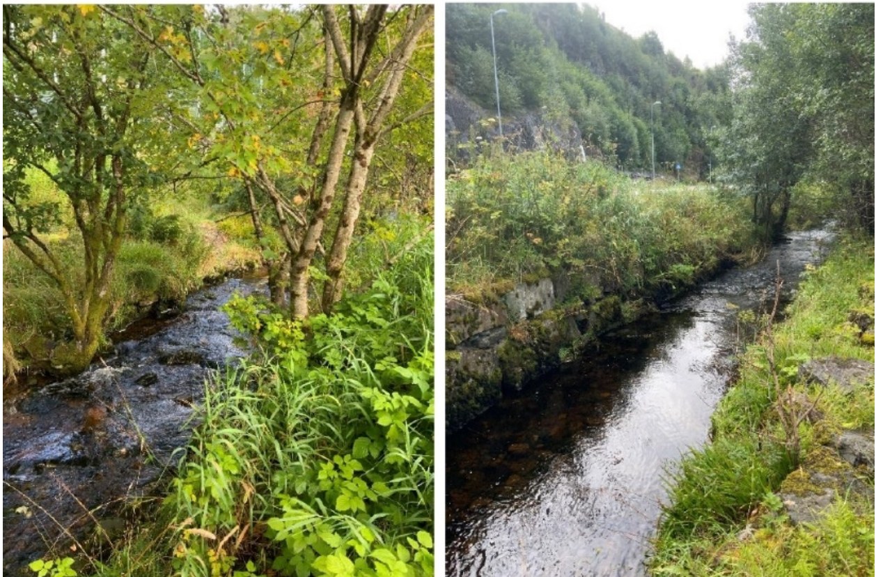
Fig 6: Sandalselven renner gjennom planområdet

Hensynet til elvedalen vest for Sandalselven og grønn økologisk korridor langs elven har vært premissgivende for utformingen av områdereguleringsplanen, og bør etter byrådets vurdering også være førende for det videre planarbeidet. Elven trenger tilstrekkelig plass for å kunne håndtere økning i nedbørsmengder og flomhendelser, sikre naturmangfold og bedre vannkvaliteten. Byråden mener at hensyn til landskap, vassdrag og dyrket mark må tillegges stor vekt.