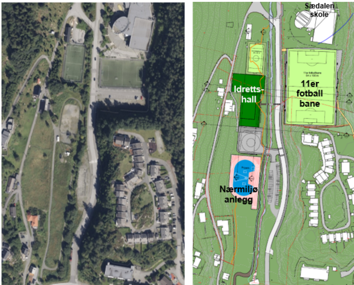
Fig 1: T.v.: Flyfoto av planområdet. T.h.: Illustrasjonsplan av det samme arealet. Mørkegrønn: nye idrettsbygg, lysegrønn: kunstgress-fotballbaner, blått/rosa: nærmiljøanlegg, grått: parkering og snuplass for lastebiler.

Plan- og bygningsetaten (PBE) ber om å fremme et planforslag for detaljregulering av Indre Sædal i Fana bydel til offentlig ettersyn. Planforslagets hovedintensjon er å tilrettelegge for en idrettshall. Forslaget er utarbeidet av PBE, men baserer seg i stor grad på materiale innlevert av Sædalen Idrettslag og aktuelle grunneiere. Planområdet ligger mellom Sandalsringen (fylkesvei) og Sædalen barneskole, utgjør om lag 58 daa og omfatter den nordlige delen av gjeldende områdereguleringsplan med arealplan ID 62650000.