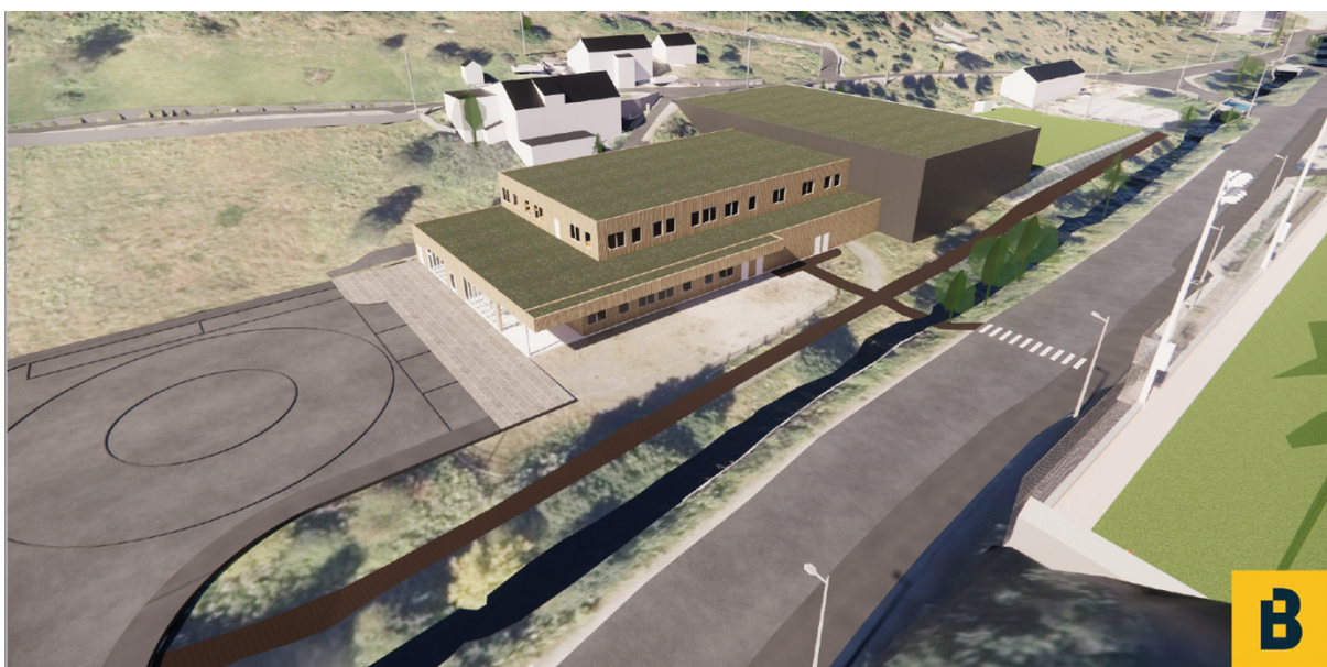
Figur 4. Illustrasjon av den nye idrettshallen

Etablering av nærmiljøanlegget frikobles fra bygging av 11-er banen og kobler rekkefølgekravet til oppføring av idrettshall. Nærmiljøanlegget blir skjøvet ut i tid og man risikerer at det ikke bygges dersom idrettshallen ikke etableres.