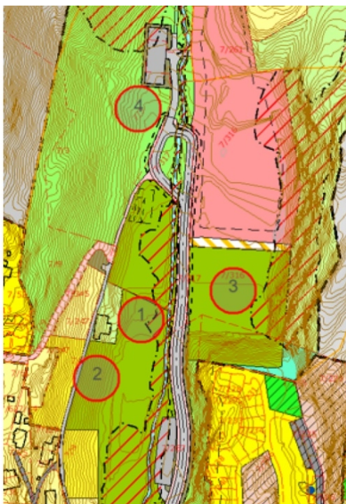
Fig2: Alternative plasseringer for idrettshallen