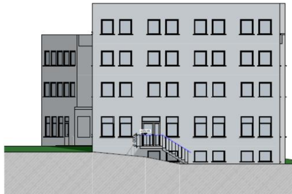
Fasade Nordvest - Ny