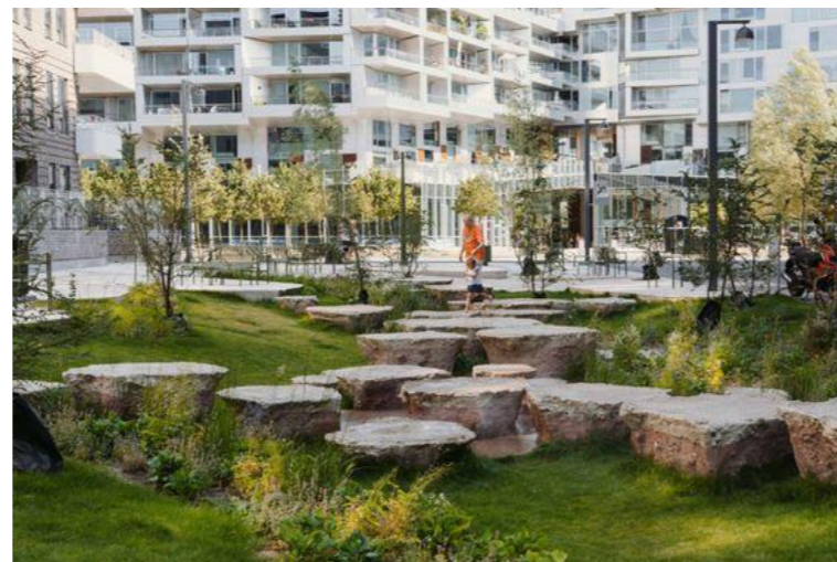
Overvanshåndtering - regnbed, beplantet drensgrøft, fordrøyning, infiltrering

Plannavn Ytrebygda gnr. 37, bnr. 5 m.fl. Østre Nordeidbrekka Plantype Detaljreguleringsplan Tegning Referanser overvannshåndtering