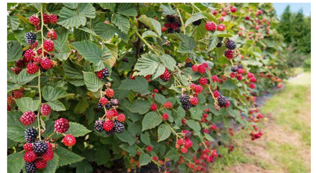
Frukt og bær

Plannavn Ytrebygda gnr. 37, bnr. 5 m.fl. Østre Nordeidbrekka Plantype Detaljreguleringsplan Tegning Referanser vegetasjon