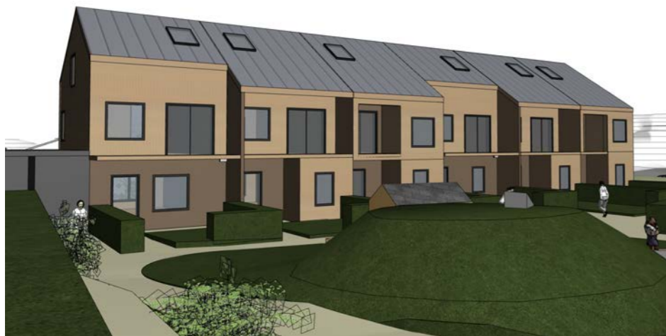
Rekkehus B fra modell