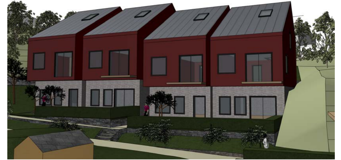
Rekkehus A fra modell