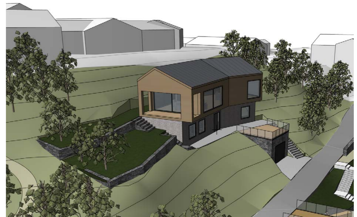
Enebolig fra modell