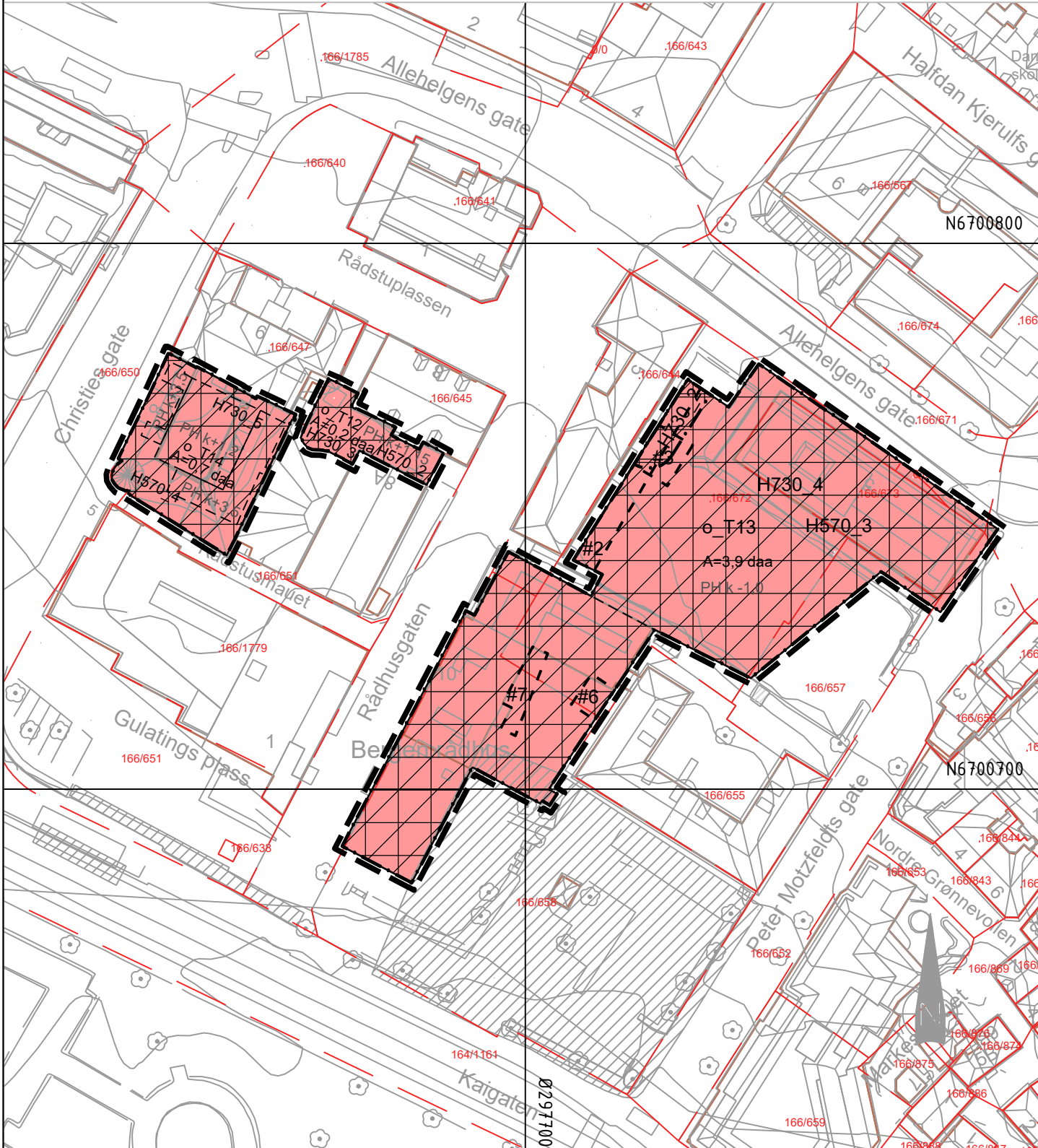
Oversiktskart vertikalnivå, Kartmålestokk 1:2000