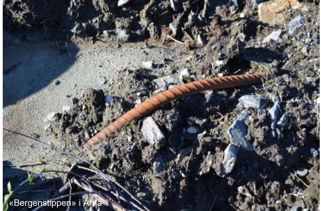
«Bergentippen» i Arna