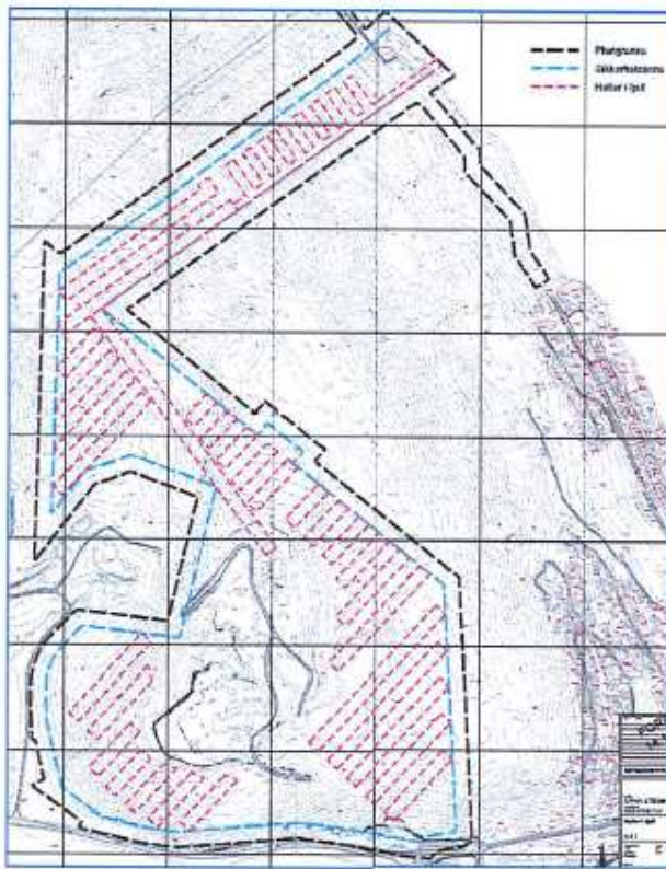
Figur 3. Alternativ 1.