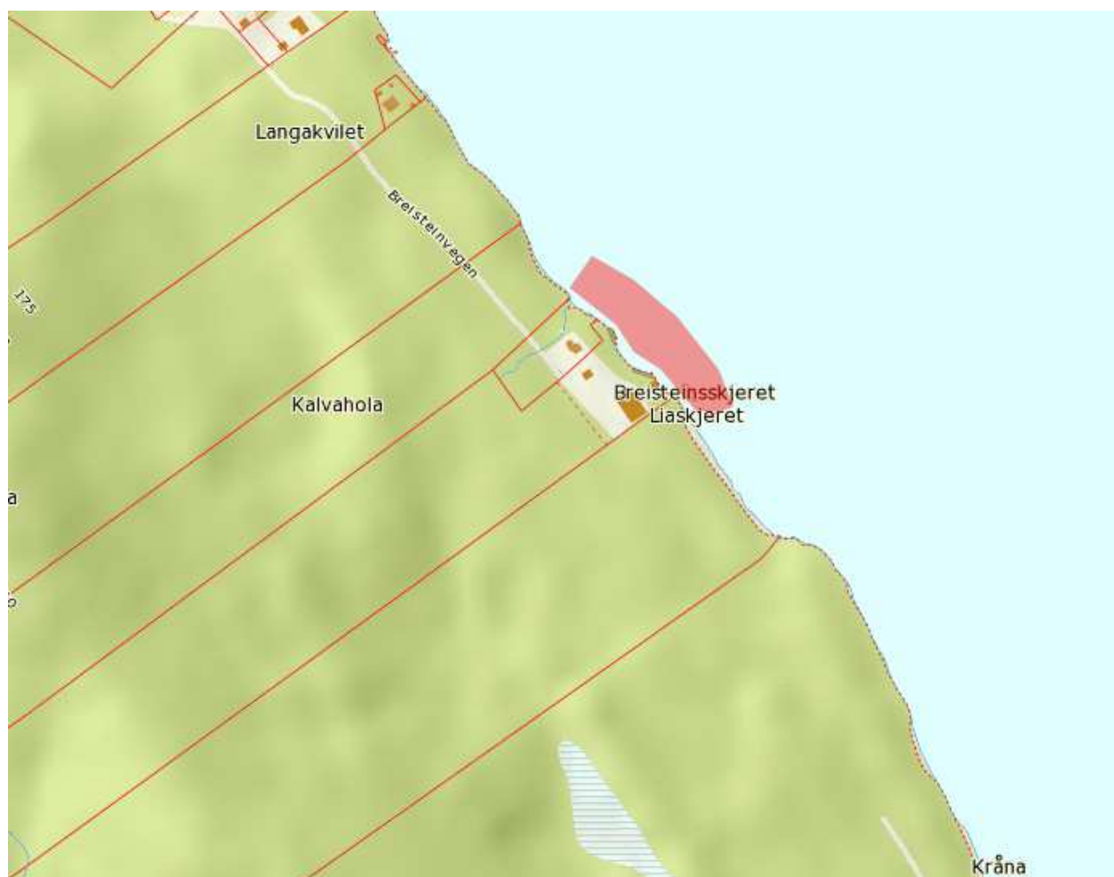
Figur 1 Kart over undersøkt område.