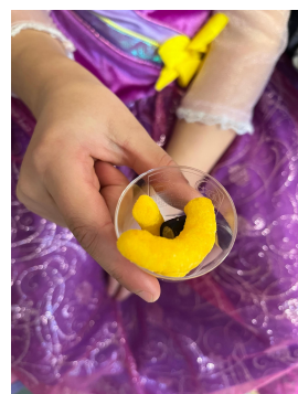
Vi smakte på L og O 😊