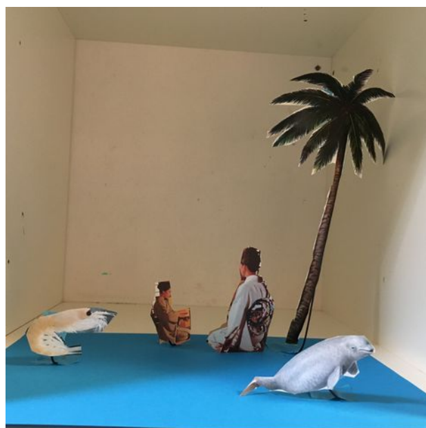
Fra utstilling i Bortigard Barnehage