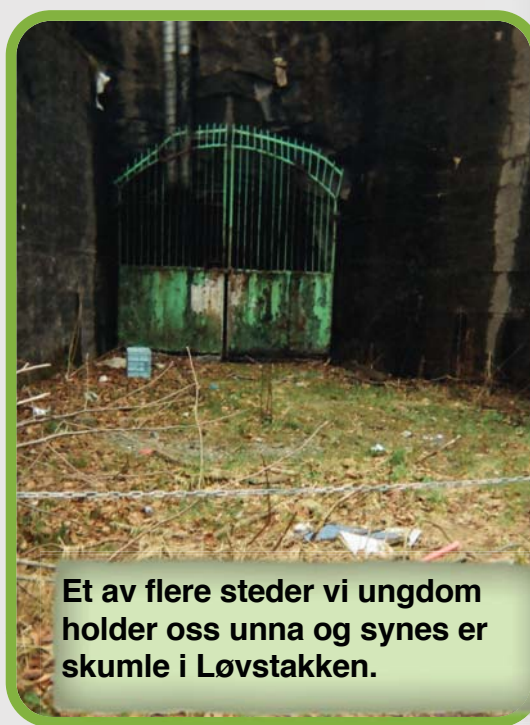
Et av flere steder vi ungdom holder oss unna og synes er skumle i Løvstakken.

Det finnes også steder som vi rett og slett syntes er stygge, dette høres kanskje brutalt ut, men det er en virkelighet. På disse stedene er det ikke mye som akkurat vi kan gjøre, men vi håper at det kan bli laget noe som kan få det til å bli finere, eller noe som kan være til glede for ungdommer, for eksempel ballbinger, basketballbaner eller kanskje bare et fint sted med en benk som man kan sitte å slappe av på. Det er selvfølgelig også viktig at vi bevarer noe av den fantastiske naturen som Løvstakken har å by på, slik at alle får se hvordan dette område virkelig ser ut, og slik at Løvstakkens beste side blir vist frem.