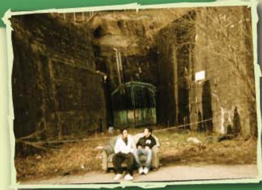
Her kunne veggene blitt malt og det kunne blitt ryddet.

“Når jeg går til skolen ser jeg masse søppel og sånt. Jeg syntes ikke det er noe hyggelig å gå til skolen. Derfor mener jeg at det skulle vært noen folk som kunne plukket opp søppel eller kommunen burde sitte opp flere søppelpanner. På vei til skolen går jeg forbi bare tre søppelpanner. De tilhører blokkene som er der. Det er heller ikke særlig mange blomster og sånt, det er veldig grått og ekkelt. Det er også steder som trengs å males.”