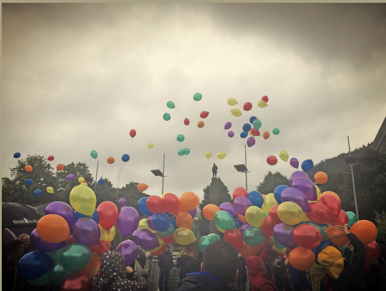
Verdens Overdosedag 2016 på Festplassen.