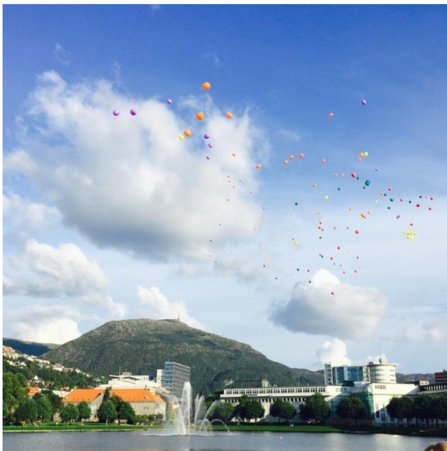
Verdens Overdosedag 2015 på Festplassen

Årlig dør 30 personer i Bergen av overdosedødsfall. Dette tilsvarer en hel skoleklasse. Bergen topper overdosestatistikken i Norge. Av den grunn er det nødvendig med en egen handlingsplan for forebygging av overdoser og overdosedødsfall.