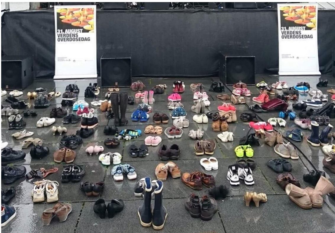
Verdens Overdosedag 2016 på Festplassen.