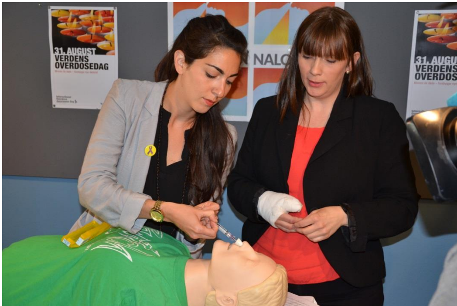
Her demonstreres bruk av Nalokson nesesypray