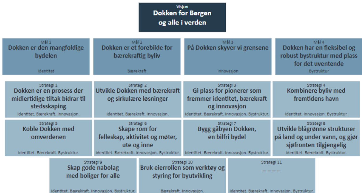
Figur 2: Oversikt over visjon, mål og strategier. Strategi 11 står åpen og vil fylles med innhold i framtiden, for å gi rom for det uventede.

Strategien er bygget opp med en visjon for hva vi ønsker Dokken skal være i 2050, med fire mål som definerer visjonen og beskriver hva vi ønsker å oppnå. De elleve strategiene beskriver hvordan målene skal nås, og gir rammer og retningslinjer for det videre arbeidet. Til slutt inneholder strategien en del som beskriver det videre arbeidet på Dokken og hva som er neste trinn i arbeidet.