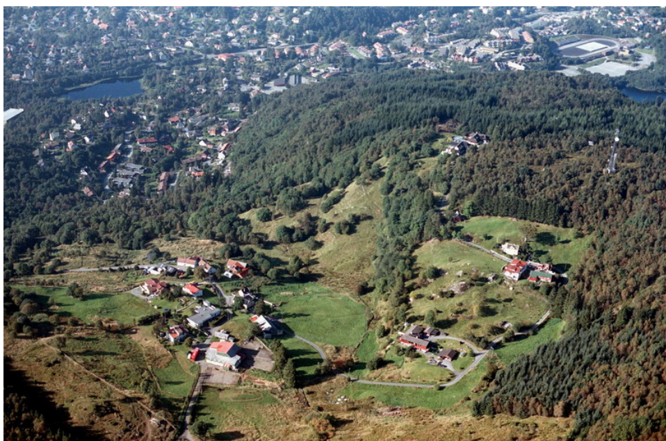
Brukene på Smørås med omkransende kulturlandskap. Eldre gårdsbebyggelse og nyere eneboliger

Smøråsen 234 moh, Stendafjellet 225 moh og Fanafjellet, med Lysskardsfjellet som høyeste punkt på 313 moh, er i hovedsak regulert til LNF-område (Landbruk, Natur, Friluft). Hamrefjellet, 277 moh utgjør en "forlengelse" av Smøråsfjellet mot sør-øst. Deler av