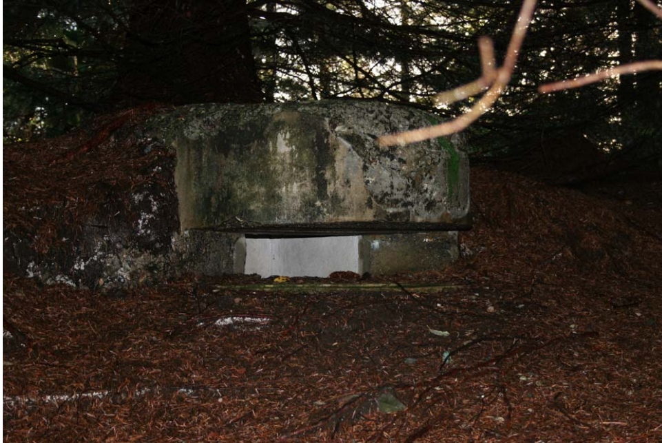
En av bunkerne på Orrhaugane.

Helt sør på Hamrefjellet finnes tre bunker tett samlet på en høyde som kalles Orrhaugane. De ligger i dag godt skjult i den tette granskogen, men har hatt fritt og godt utsyn ned mot Klokkarvatnet, østover mot Hamre og vestover mot Fanahammeren. To av bunkerne har ser ut til å ha vært utkikksposter med smale skyteskår. Den siste har ingen andre åpninger enn døren, og har antagelig vært et ammunisjonslager eller lignende.