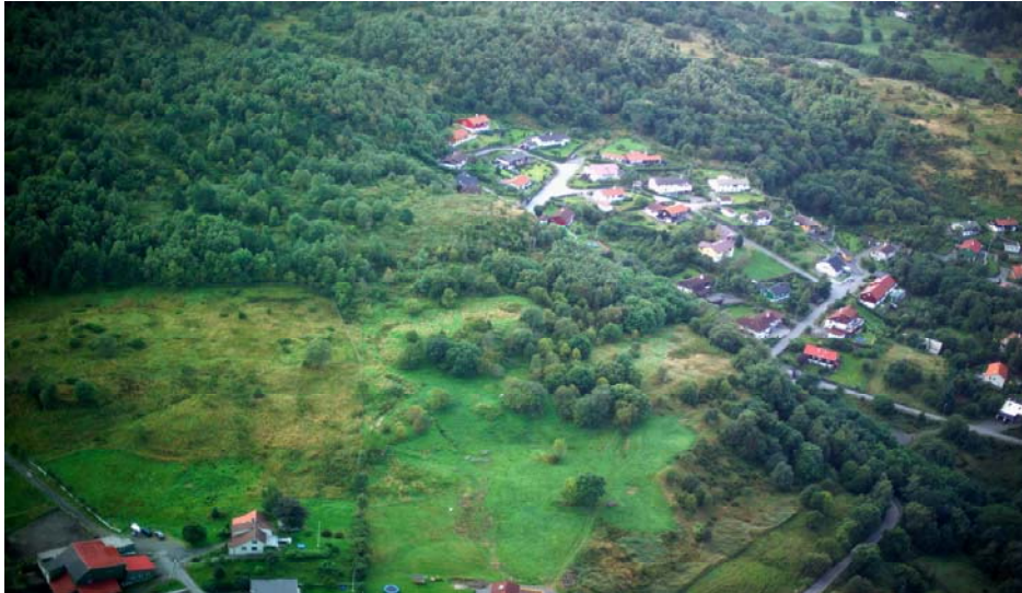
Smørås hageby.

Hovedtunet på Smørås har mye av den gamle tunstrukturen og gårdsbebyggelsen i behold, men her har også kommet til senere bebyggelse. Gårdsbebyggelsen har antikvarisk egen- og miljøverdi med historiefortellende kvaliteter som kan vitne om tidligere tiders bo- og levesett.