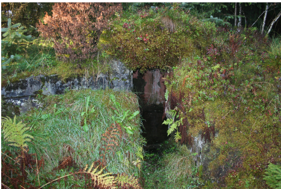
Inngang til en av bunkerne, trolig ammunisjonslager, på Orrhaugane.

I randsonene for fjellområdene ble det flere steder anlagt batterier og forsvarsverk, deriblant minefelt. Britiske etterretningskart fra 1944 viser militære anlegg ved Stend, Fanahammeren, Breivika ved Rød, Austrevågen og på begge sider av eidet på Krokeide. Den søndre delen av Korsneset var tungt befestet, og er stadig militært område og avstengt for publikum. Disse områdene ligger utenfor området som dette kulturminnegrunnlaget dekker, og er derfor ikke undersøkt nærmere.