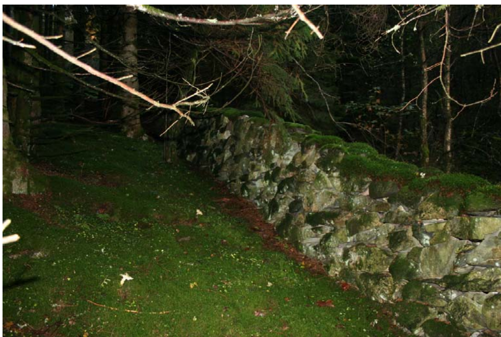
Steingard ved Raunhaugen helt sør på Hamrefjellet.

I fjellområdene er det relativt få spor etter menneskelig aktivitet. Delvis skyldes dette nye driftsformer i landbruket, eller at gårdsdriften har blitt nedlagt. Også den omfattende treplantingen og gjengroingen har ført til at rester og spor etter tidligere tiders bruk og drift av området har forsvunnet. Likevel finnes der noen historiefortellende strukturer. I første rekke gjelder det rester og spor etter stølsdrift, utmarksveier, stemmer, kverner og steingarder. Dette er viktige spor som er med på å formidle et helhetlig bilde av tidligere tiders aktivitet i området.