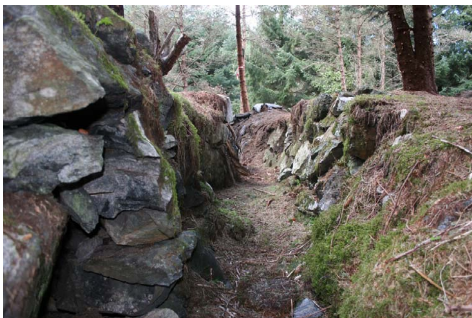
Skytter-/løpegrav på Smøråsfjellet.

På sørøst-siden av Smøråsfjellet finnes en løpe- eller skyttergrav. Den ligger like øst for "Ytrestien" ved Revasteinen. Skyttergraven er tørrmurt og skal være anlagt