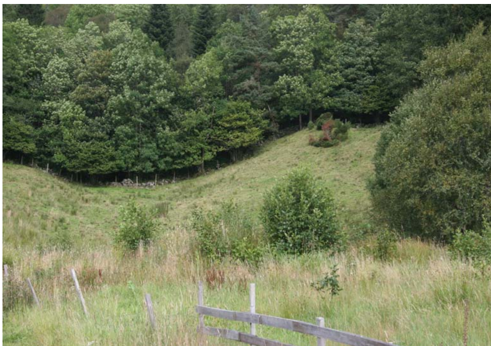
Kulturlandskap ved foten av Stendafjellet. Steingarden markerer skillet mellom beitemark og utmark.