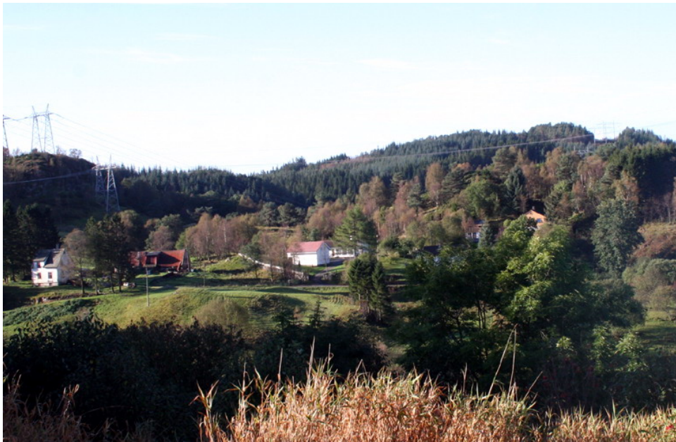
Bruk 3 på Nøttveit.

Nøttveit var i middelalderen klostergods under Nonneseter kloster og skal ha blitt tatt opp som egen gård på slutten av 1400-tallet, men trolig var den ryddet alt i vikingtid. Etter