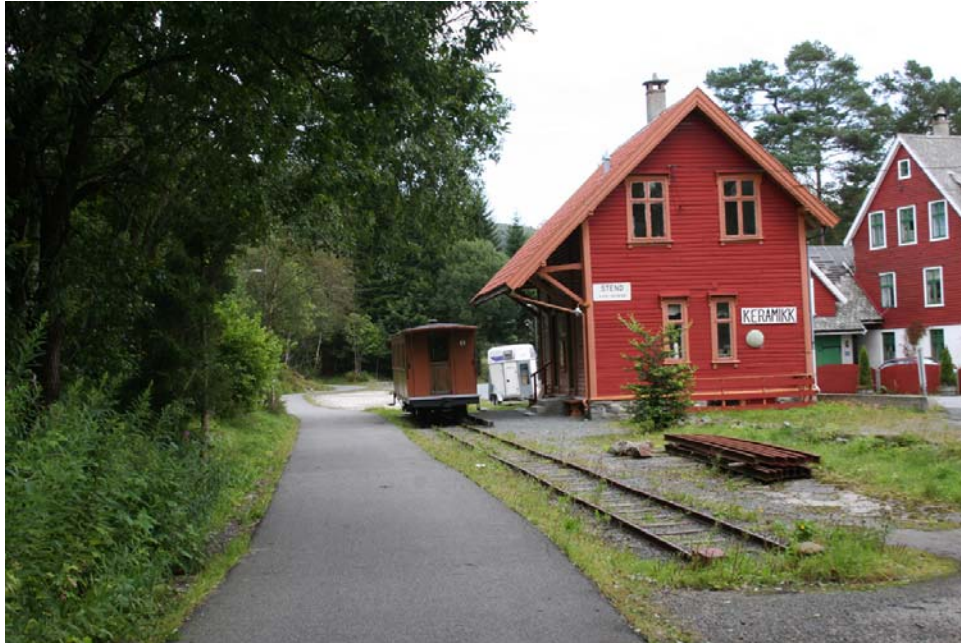
Stend stasjon.

En kostnadsdrivende faktor ved baneanleggelsen var tunnelbygging. Ved anleggelse av