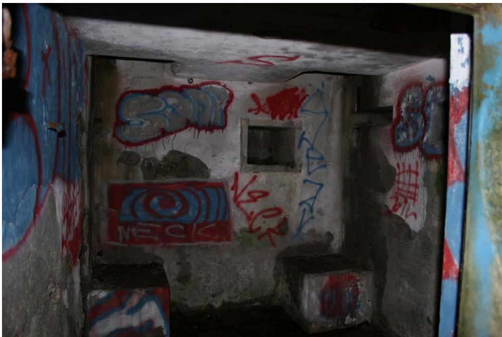
Innerom fra en av bunkerne. Glugger i taket for observasjon og overvåking av omgivelsene.