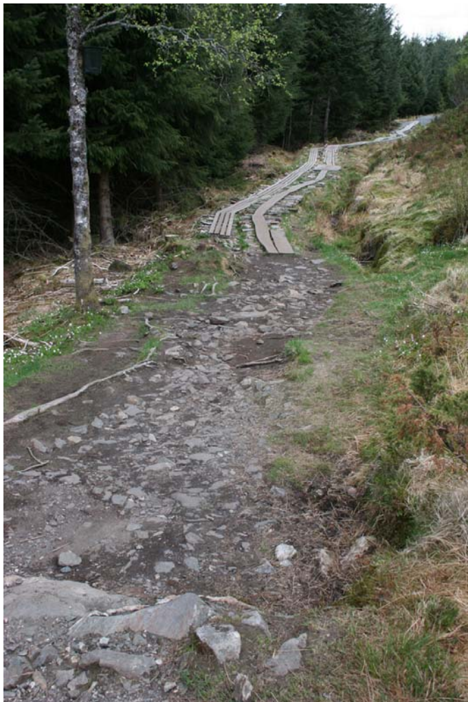
Militærveien med tredekke over fuktige partier.

kjerreveier ble laget på 1800-tallet, med steinsatt veilegeme og veikanter av større steinblokker. Veien er i god teknisk stand og vedlikeholdes av lokale krefter. Men tett tilvekst