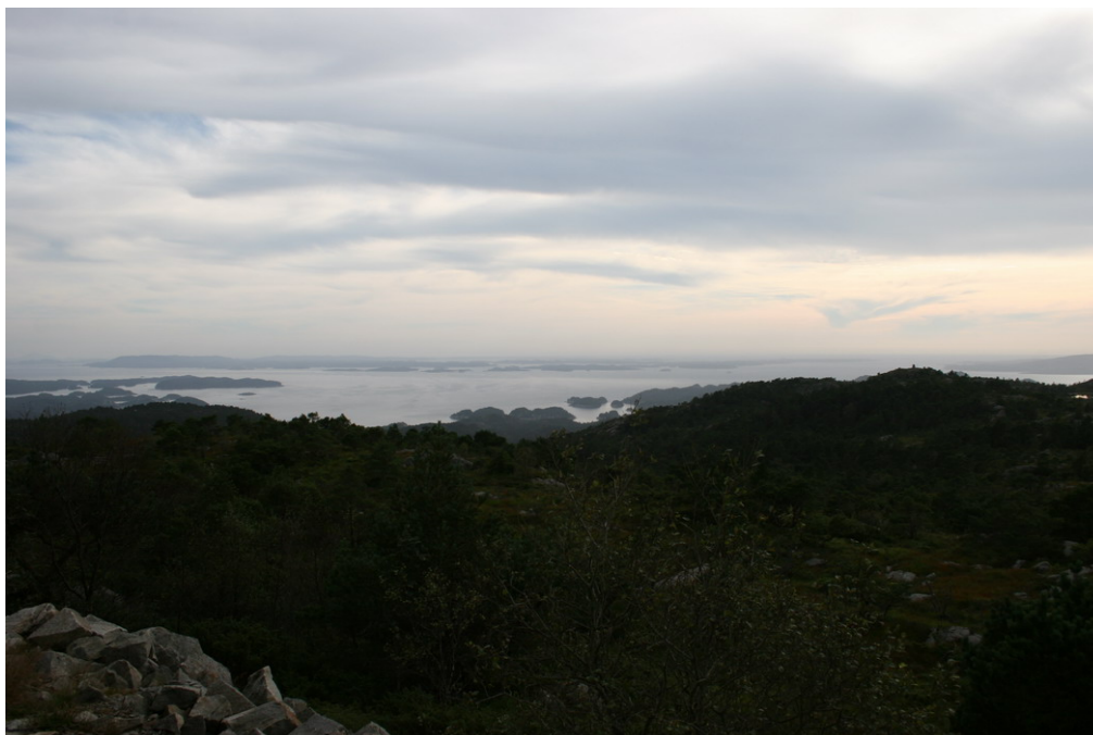
Utsikt mot Korsfjorden og Austevoll. Varde på Storemunken til høyre.

Halvøyen mellom Fanafjorden og Lysefjorden er et relativt høyt og bredt, delvis skogkledd fjellandskap. I hovedsak skrår terrenget bratt ned mot fjordene, og i det indre er det splittet opp av myrlendte daler og søkk. Fjellryggen består av flere topper, regnet fra nord mot sør er dette Ramberget 299 moh med en steil vestvegg, Høgåsane 309 moh, Lysskardfjellet – halvøyens høyeste punkt på 313 moh og Folldalshaugen med 300 moh. Fra Folldalshaugen har man fri sikt mot Lysefjorden, deler av Os i sørøst, og over Fana og Bergens omland mot nord. Mot Lysefjorden finnes Stokkfjellet med 239 moh med steil avhelling mot sydøst og Ospevikfjellet med 137 moh. Hisdalen skiller disse toppene fra den øvrige fjellryggen. I halvøyens ytterkanter for øvrig finnes Grønefjellet med 243 moh, Ramsen med 180 moh, Munken med 192 moh og Urafjellet med 191 moh.