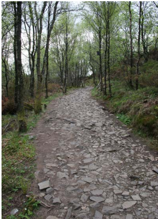
Parti av Militærveien.

Fra Smørås går det en gammel kjerrevei opp på Hamrefjellet og i ring rundt Bjørnekletten, Bjørnevatn og Smøråskletten, med en utløper til Nøttveit vest for Bjørnevatn. Veien er imidlertid ikke en ordinær kjerrevei, men er bygget som forsvarsanlegg av soldater innkalt til nøytralitetsvakt i 1914-15. Etter 1898 var Bergen by svært vanskelig å erobre fra sjøsiden. Man fryktet derfor landgang på Fanahammeren eller Flesland-Hjellestad området, og landverts fremrykning herfra. Militærveien var derfor ment for nærforsvar med mobile 8,4 cm feltkanoner. Fra Hamrefjellet kunne man dermed beskytte en fiende i hele området mellom Fanafjellet og Nordåsvannet. Militærveien skulle bare gi sikker tilkomst og tilførsel av ammunisjon samt rom for manøvrering av artilleriet.