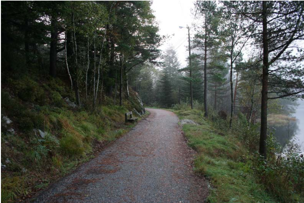
Parti av Obanetraseen, her ved Klokkarvatnet.

konkurransedyktig. Banen ble nedlagt i 1935, men selskapet, som hadde startet bilrute i 1927, fortsatte som A/S Bilruta Os-Bergen.