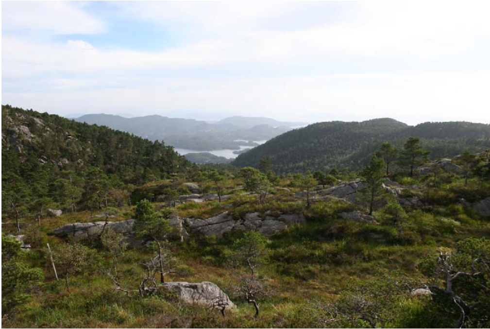
Fra Fanafjellet mot Lysskaret og Lysefjorden.

For folk fra Nordvik var det lang og tungvint sjøverts transport rundt Korsneset. I stedet valgte de veien til fots over fjellet. Denne veien eller stien gikk over Fanafjellet gjennom Lysskaret på vei til kirken. Denne ferdselsåren må sannsynligvis ha vært i bruk alt i middelalderen, og dagens tursti gjennom Lysskaret tangerer trolig traseen for den gamle ferdselsåren.