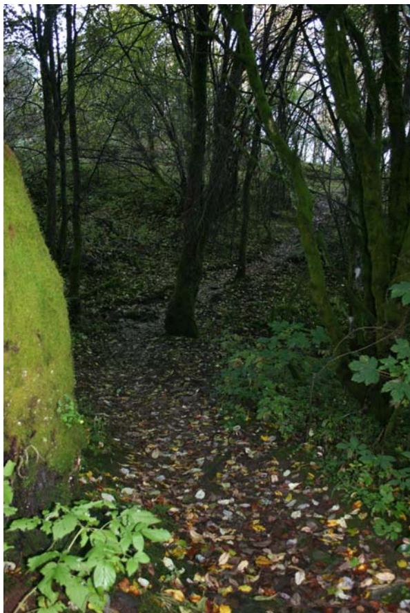
Stien mellom Nøttveit og Smørås, mulig trasé for den gamle kirkeveien.

Fana kirke er første gang nevnt i skriftlige kilder i 1228, men ble trolig oppført i siste halvdel av 1100-tallet. I 1303 ble kirken avstått til Apostelkirken, men ble krongods etter reformasjonen. I 1741 ble den kjøpt av Wollert Danckertsen og kom dermed i slektene Krohn og Konows eie frem til Fana kommune overtok den i 1862.