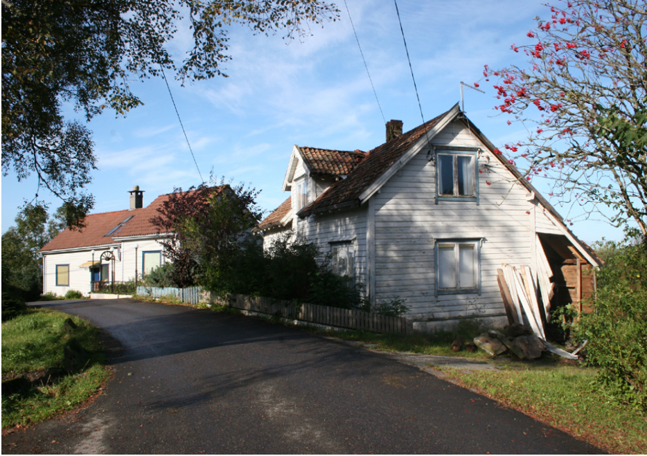
Eldre våningshus på Smørås.

Smøråsen, eller Smøråsfjellet, har sitt høyeste punkt på 234 meter over havet. Mot nord ligger Smørås-gården og mot vest ligger brukene på Nøttveit, begge 186 moh. Grensen mellom Smørås og Nøttveit går omtrent midt over Bjørnevann, nordover langs