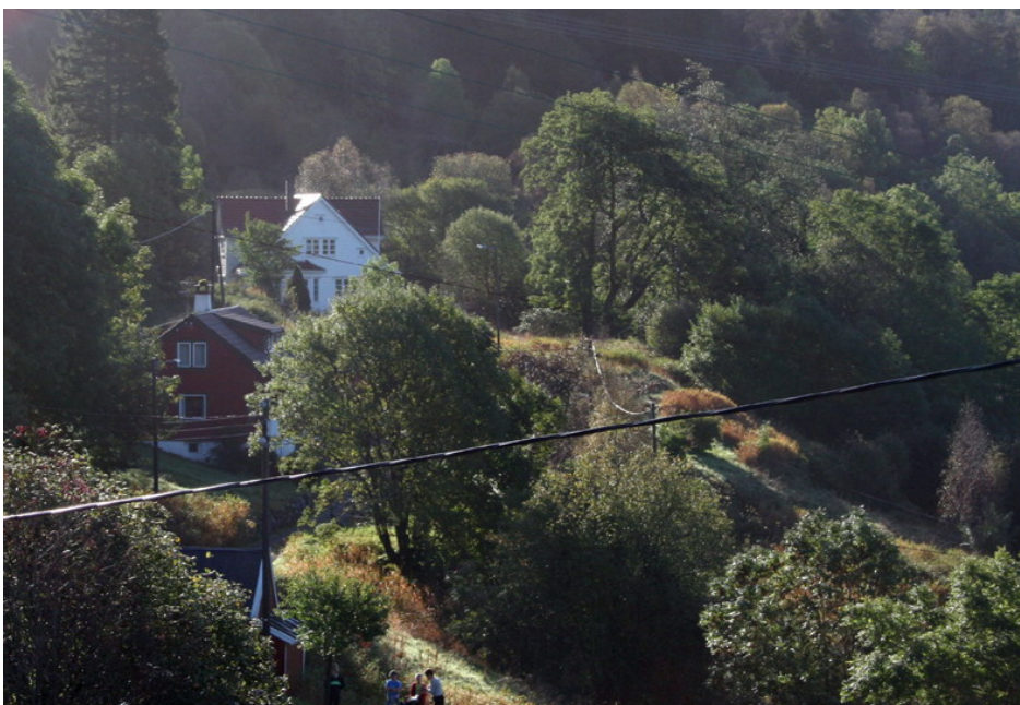
Det opprinnelige bruk 1 på Nøttveit.

Svartedauden lå gården øde, men ble trolig nyttet som seter under Skjold-gården. Da Vincent Lunge fratrådte som lensherre på Bergenhus i 1528, overdro kong Fredrik alt jordegods som hadde tilhørt Nonneseter til Lunge. Nøttveit skal ha blitt gjenryddet i 1580. Fra 1600-tallet og