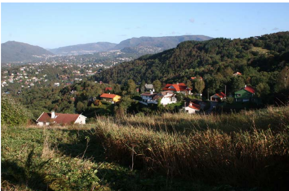
Smørås hageby.

Andre gårder i nærheten har hatt utmarksteiger her. Her har det blant annet vært beitemarker, stølsdrift og torvtaking. Nedlagt gårdsdrift, granplanting, generell gjengroing samt nyere bebyggelse i randsonen, har endret landskapet vesentlig fra den gang her var gårdsbruk i drift. I dag er området populært som turområde, og særlig den gamle militærveien brukes flittig.