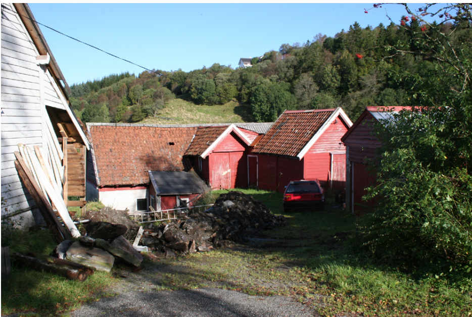
Driftsbygninger på Smørås.

I området her har det vært gårdsdrift i lang tid, og fremdeles finnes her noe kulturlandskap i behold, samt spor etter tidligere tiders jordbruksdrift. I skriftlige kilder nevnes Smørås i Bjørgvins Kalvskinn fra ca 1350. Her fremgår det at Birkeland kirke mottok 1/6 landskyld av