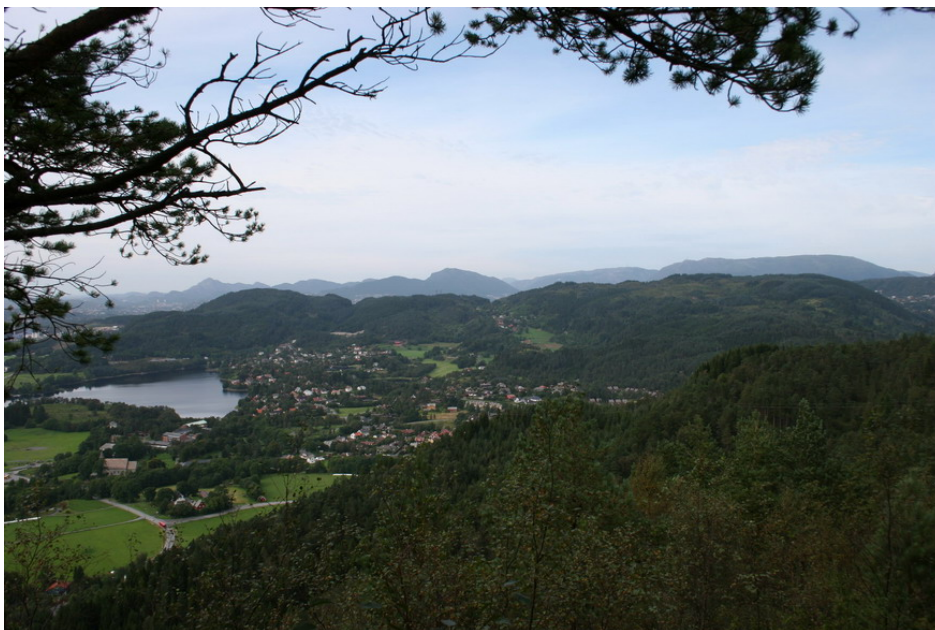
Utsikt fra Fanafjellet mot Stendafjellet (t.v.) og Smøråsfjellet. Randsone med kulturlandskap og bebyggelse. Fana kirke i venstre billedkant.

Dette kulturminne- grunnlaget er ment som grunnlagsmateriale for forvaltningsplan for byfjellene sør. Områdene som dekkes av kulturminnegrunnlaget, er i første rekke Smørås med Hamrefjellet, kalt Smøråsfjellet, og Stendafjellet. Fanafjellet er tatt med fordi dette inngår i kommunens overordnede arbeid med forvaltningsplaner for byfjellene.