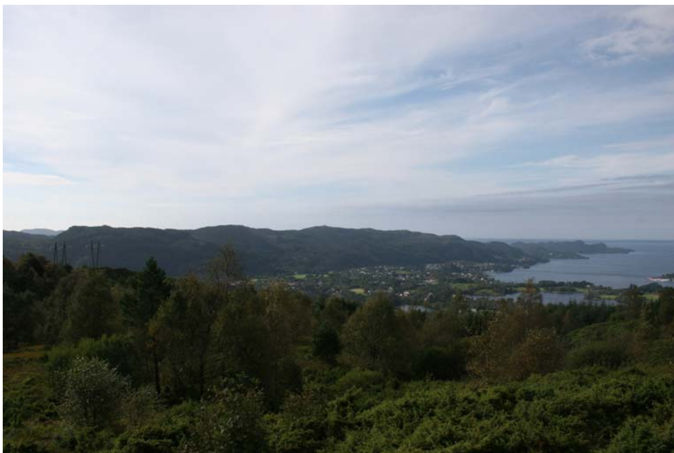
Fanafjellet mot Korsneset. Kulturlandskap og bebyggelse i randsonen.

På Kirkebirkeland ligger det fredete kirkestedet, der Birkeland kirke i sin tid lå. Ved Hatlestad ligger fire arkeologiske lokaliteter med en gravhaug, ildsteder og kokegrop knyttet til aktivitetsflate som bosetning eller gravfelt. På Stend ligger den vedtaksfredete hovedgården og flere gravhauger ved Hordamuseet.