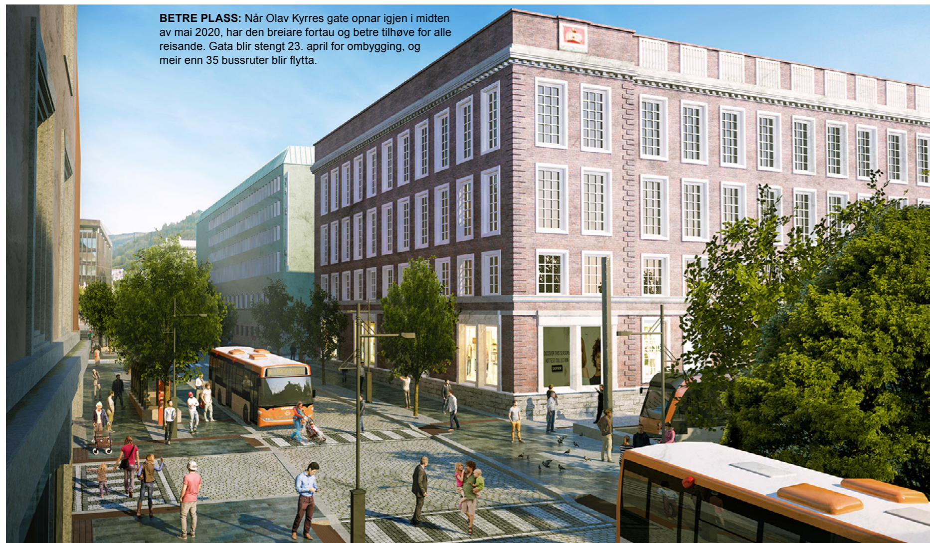
BETRE Plass: Når Olav Kyrres gate oppnar igjen i midten av mai 2020, har den breiare fortau og betre tilhøve for alle reisande. Gata blir stengt 23. april for ombygging, og meir enn 35 bussruter blir flytta.