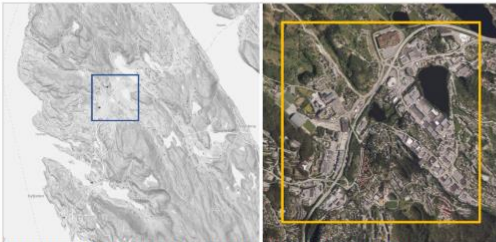
Figur 1: Avgrensing av planområde for strategisk planprogram, oversiktskart og flyfoto

Åsane bydel ligger nord for Bergen sentrum. Innbyggertallet nærmer seg 42.000. Bydelen er avgrenset av Eidsvåg i sør, Hylkje i nord, Salhus i vest og Flaktveit i øst. Forventet befolkningsvekst er om lag 5000 innbyggere fram mot år 2040. Planområdet inkluderer bydelssenteret i Åsane, med tilhørende omland. Åsane er nest største bydel for varehandel, kun Bergenhus er større. Åsane er et regionalt handelssentrum, og nærmere 25 % av arbeidsplassene er knyttet til varehandel. Det er utarbeidet en handelsanalyse for Åsane, vedlegg Handelsanalyse Åsane datert februar 2022 .